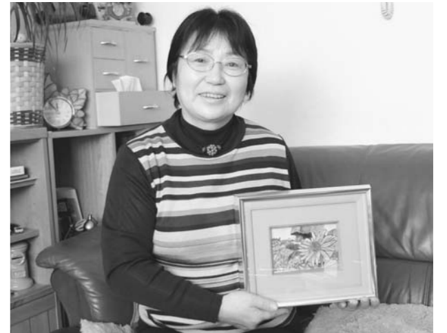
▲私を救った『希望』と一緒に

長男が住んでいる日光市に腰をすえて、ご主人とご主人のお母さんの3人で暮らしています。