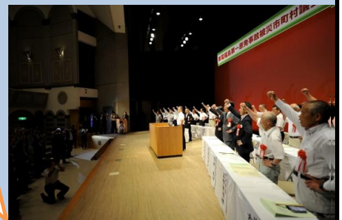
田村市での総決起大会

原子力災害に関する賠償への対応などを求める特別決議を採択し、県知事等に決議文を提出した。