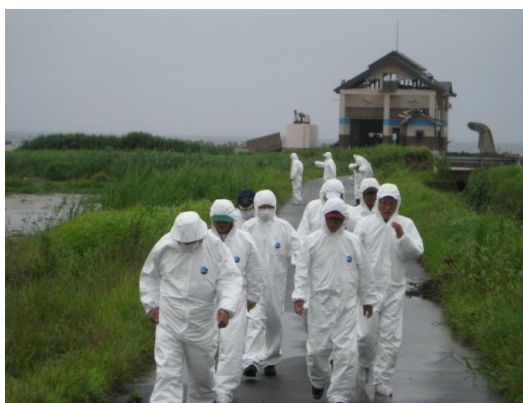
請戸中浜水門現地視察