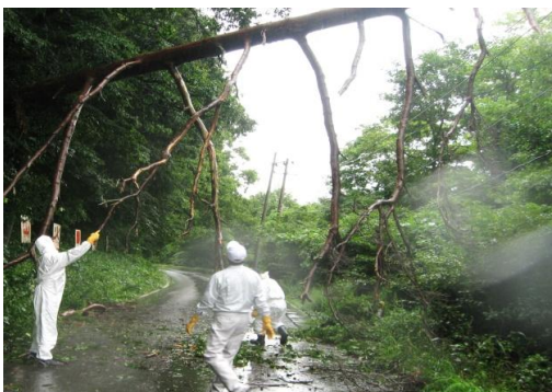
現地調査に向かう途中の倒木撤去作業 (国道114号赤宇木柵平付近)

町民の皆さまの一時帰宅がほぼ一巡したのを機に、議会として町内の被害状況の現地調査に入りました。