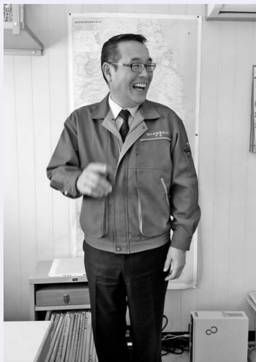
▲「有限会社 中西測量設計」 二本松営業所にて

今、中西さんは相双地区と二本松市等を営業範囲として、事業を行っていらっしゃいます。