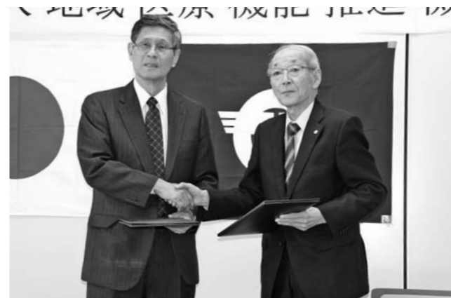
5月7日、協定調印式(役場二本松事務所)

協定では、同機構の二本松病院の栄養士や理学療法士が仮設住宅を訪問し、健康相談や高齢者の理学療法のサポートを行うほか、全国に避難する町民の甲状腺検査や健康相談などの支援を行うとしています。