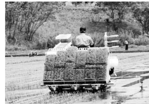
水稲試験栽培風景