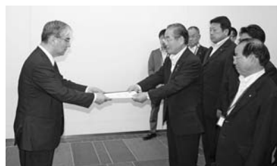
東京電力(株)新妻常務執行役へ