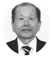
若月 芳則 議員