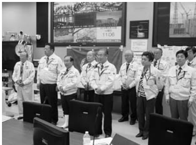
福島第一原子力発電所内