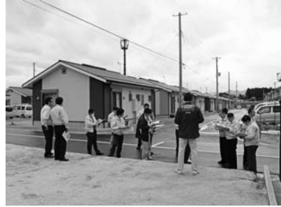
南相馬市西川原団地