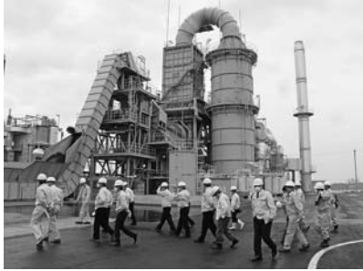
相馬市・新地町仮設焼却炉

4月21日に、相馬市・新地町仮設焼却炉と2か所の災害公営住宅（相馬市程田明神前団地、南相馬市西川原団地）、5月13日には、東京電力福島第一原子力発電所の現状といわき市の復興公営住宅モデルルームをそれぞれ視察しました。