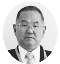
松田 孝司 議員

健康保険課長 すべてにおいて健康に及ぼす数値のほうはいいですね。飲食等には十分に注意し、健康手帳の活用、自己管理に努めてほしいと考えます。