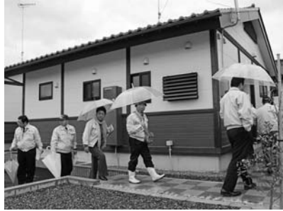
相馬市程田明神前団地