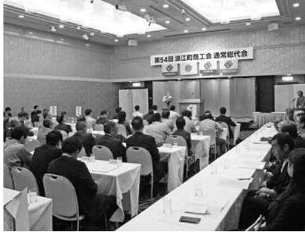
事業再開に向けて

町民税務課長 納税される町民の負担等を、十分に考慮して、広報措置や体制を整えてから、延長措置を解除するようにお願いしています。今後は国税庁との協議の中で、現況を踏まえて検討したいと考えています。