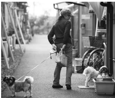
仮設住宅を散歩するペット愛好家

生活支援課長 高齢者の長時間の移動や自宅内の片付け等は、肉体的にも負担が大きく、月1回2時間以内の立入りが妥当だと思えます。