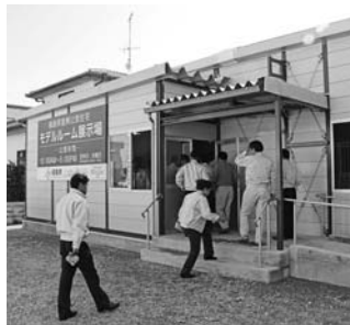
いわき市の復興公営住宅モデルルームと間取り