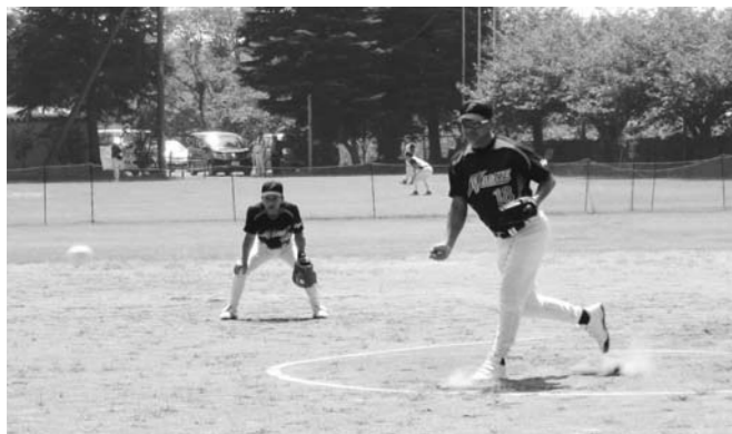
壮年ソフトボール