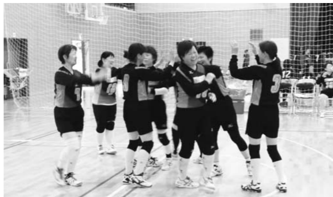
家庭婦人バレーボール