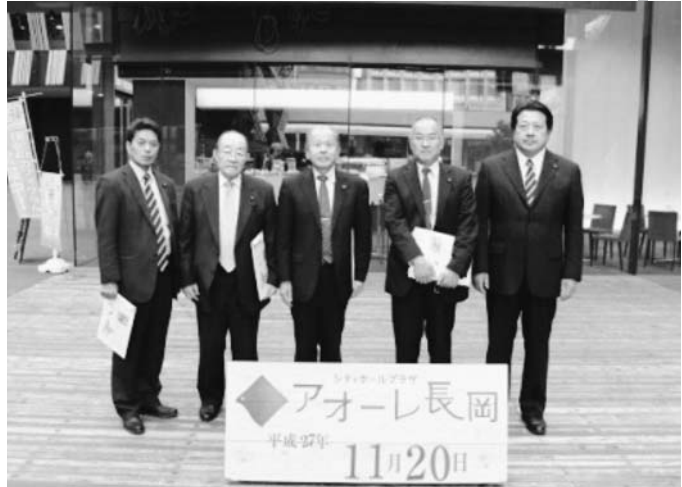
まちなか市役所「アオーレ長岡」

山古志地区は、全村避難し、帰還した地区ですが、復興交流館で展示された古里への思い、リーダーシップをとり村民と共に行動した方々には感心しました。最後に山古志地区の現在の姿と震災時の状況を現地案内説明していただき、非常に参考になりました。