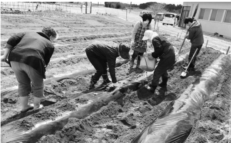
実証栽培（ジャガイモ定植）

福島県営農再開支援事業の新規事業として家畜の飼養実証事業が平成28年に実施されることとなりました。現時点で飼育実証については、畜産農家からの事業希望等はありませんが、希望があった時点で町でも前向きな形で取り組んでいきたいと思っております。