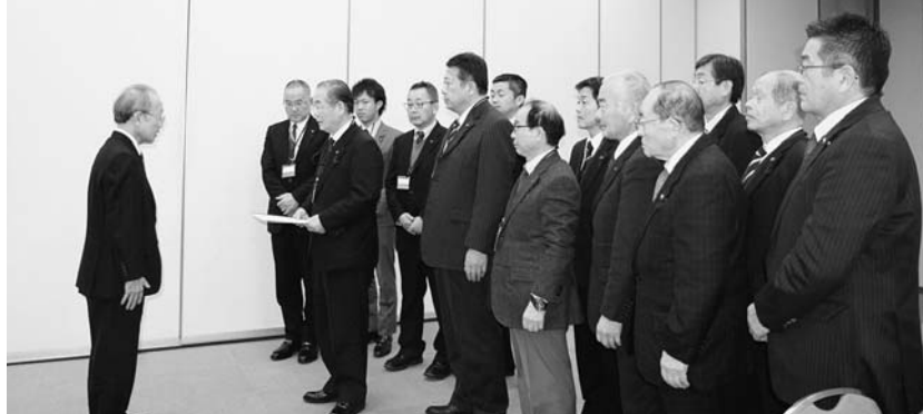
東京電力㈱にて要求書を提出

1月22日、東京電力株式会社ほか関係機関に対し、浪江町ADR集団申立てに関する要求(要望)活動を行うとともに、環境省が示した森林除染の方針を受け、関係機関に対して地域再生と森林除染を一体とした環境回復対策の強化を求める要望活動を行いました。 それぞれの要求(要望)の内容は、「その1」、「その2」及び「その3」のとおりです。