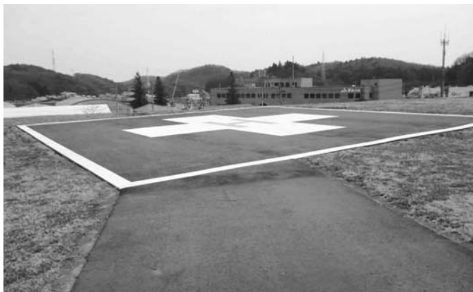
設置が求められるヘリポート

ホームやショートステイは、今のところ浪江で再開する業者はないことから、いわきにできるオンフル双葉や近隣の町村の施設に依頼する必要が出てきます。基本的には介護人材の確保でありますので、国県にも協力を仰ぎ、努力を重ねます。