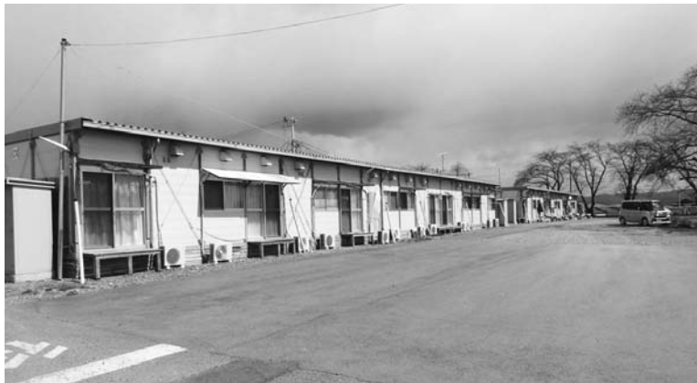
空き室が目立つ仮設住宅

〔質問〕 これから復興公営住宅への入居も本格化し、それにつれて仮設住宅の空室率もますます増え、近隣同士のつながりも薄くなり、孤立化しがちな高齢者など弱者の見守りが重要になると思います。 今後、仮設住宅内敷地の維持管理も大変ではないかと思えます。今までと変わった支援体制が必要になると思われますが、これからの支援体制をどう考えていますか。