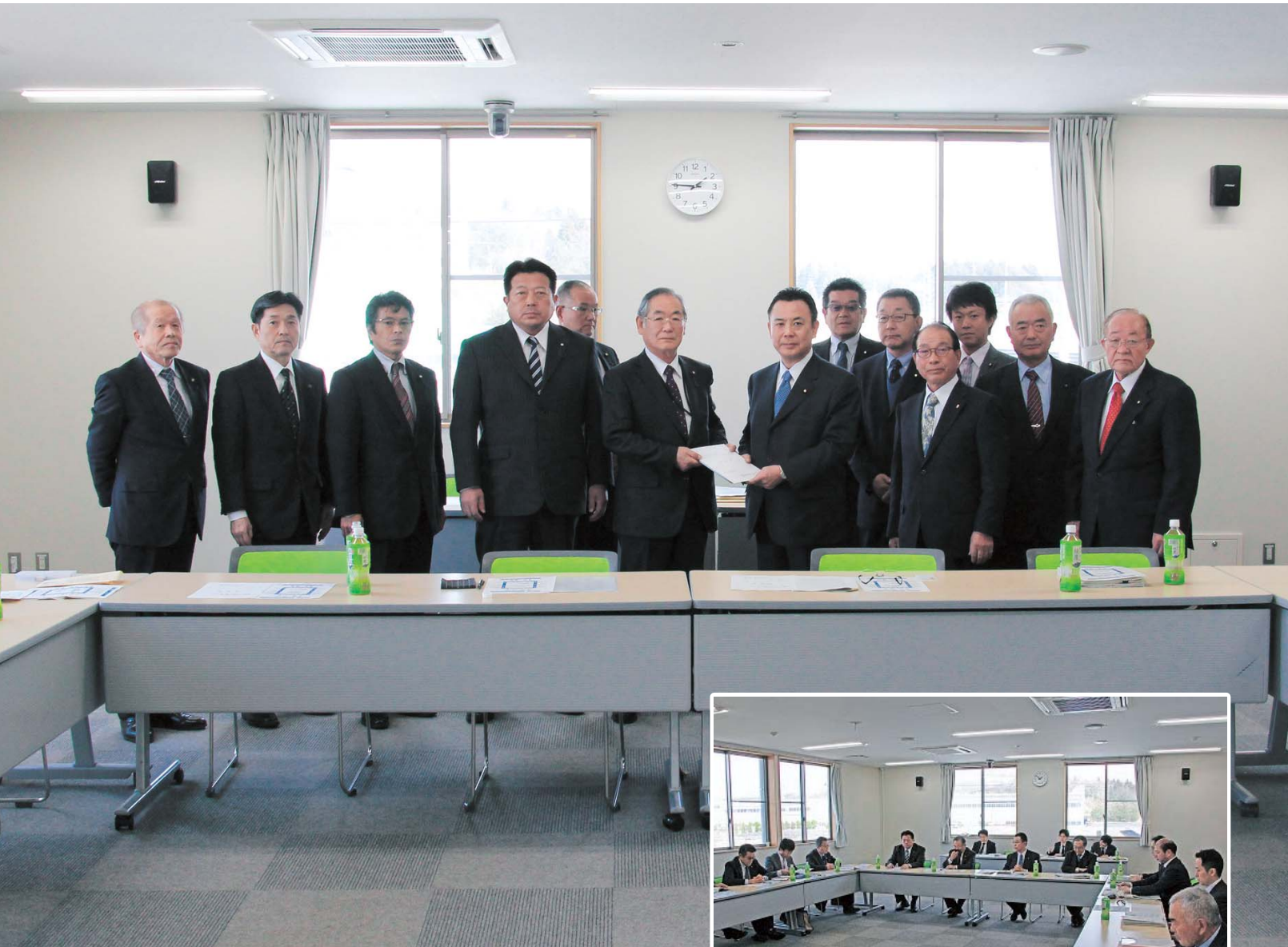
原子力災害現地対策本部長（高木陽介経済産業副大臣）との意見交換会 （3月27日 浪江町役場二本松事務所）