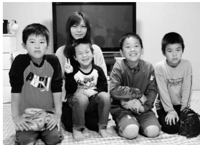
▲お子さんたちと一緒に。

震災後にご主人の実家から浪江町津島地区のつしま活性化センター、いわき市、塙町へと移動しながら避難。現在は会津若松市北滝沢のアパートで、お子さんたちの笑顔に励まされながら、ご家族で暮らしていらっやいます。