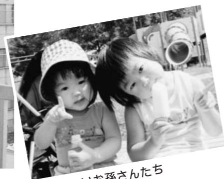
▲かわいいお孫さんたち