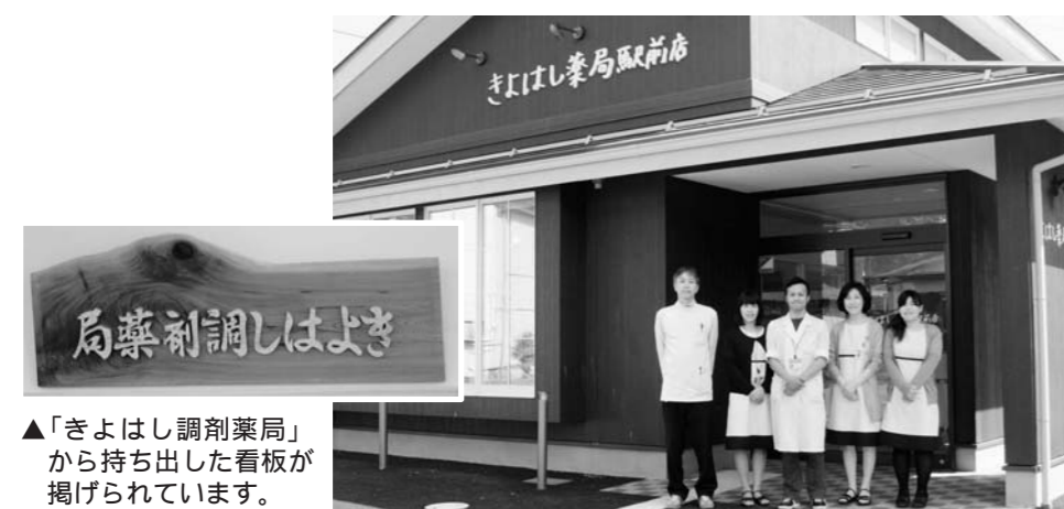
▲「きよはし調剤薬局」から持ち出した看板が掲げられています。

その後、縁あって「薬局を新しく作ろう。」というお話をいただき、三春町で薬局を再開することにしました。名前を決めるときに社長が「きよはし」の名前を残しましょう。」と言って、名前を「きよはし薬局駅前店」に決め、3月5日にオープン。オープン前には、「ここでやっても浪江とは違うし、これでいいのよ。」という気持ちになったこともありましたが、事業を再開した方に多かれ少なかれある気持ちだと思えますが、「みんな