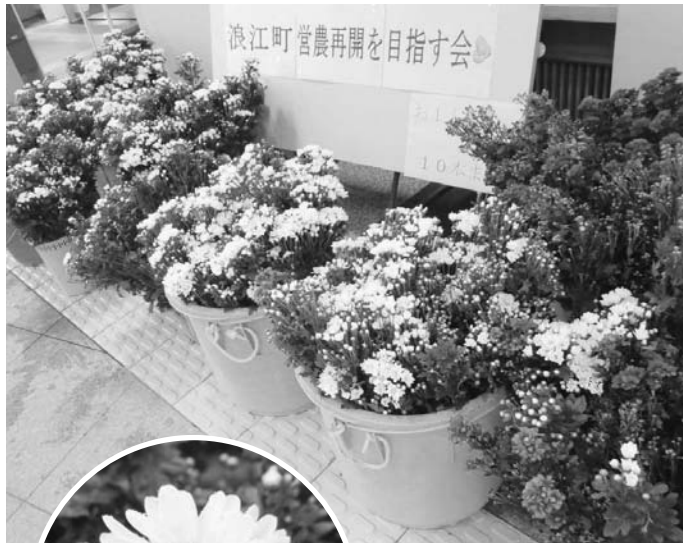
▲役場で配布している様子