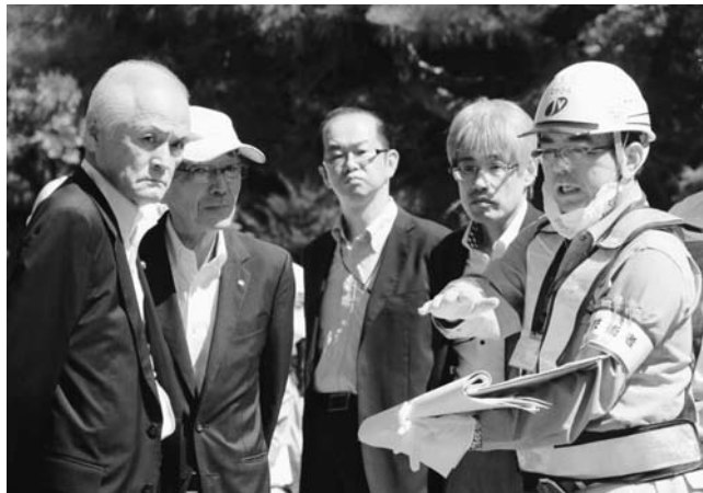
除染現場視察の様子