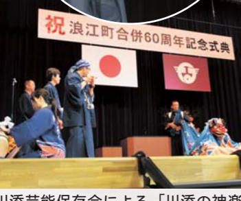
川添芸能保存会による「川添の神楽」