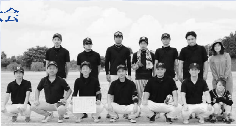
優勝チーム Team SSB