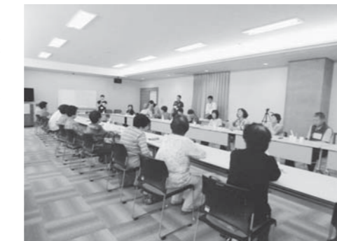
参加者から健康相談員への質問場面

など、参加者からはいろいろな工夫が発表されました。 また、よい香りのするアロマ石鹸を全員で作成し、お持ち帰りいただきました。