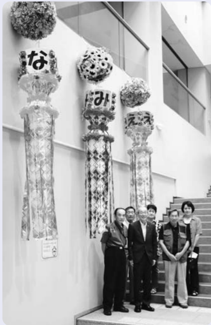
8月4日 なみえ絆いわき会様 (七夕飾り)