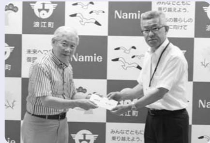
8月1日 武田彰二様 (義援金)