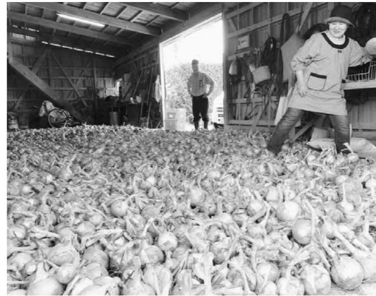
収穫後に倉庫で乾燥させている様子

双葉農業普及所では、双葉郡の玉ねぎ産地化を目指し、各町村への指導を進めています。浪江町では、4軒の農家が普及所の指導を受け、7月に新玉