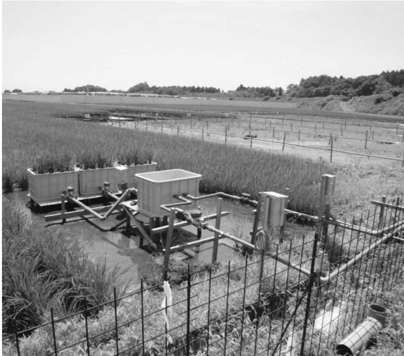
試験ほ場の様子（水口側）