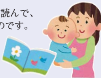
☎ 浪江にじいろこども園 ☎ 0240(25)8619

「子供と一緒に楽しむ、絵本のある幸せな時間を」楽しんでください。 たくさんの素晴らしい絵本がお母さん、お父さんを待っています。 まずは、一冊、手に取って読んでみてください。