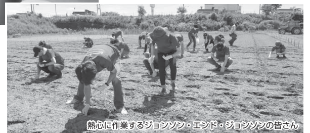
熱心に作業するジョシソン・エンド・ジョシソンの皆さん