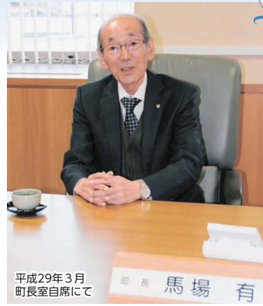
平成29年3月 町長室自席にて

また、東日本大震災と東京電力福島第一原子力発電所事故後は、「全ての町民の暮らしを再建する」「ふるさとを再生する」「被災経験を次代や日本に生かす」を復興の基本方針として、町民の先頭に立ち町の復旧・復興にまい進するとともに「まちのこし」へ全身全霊で取り組まれました。