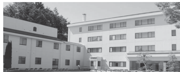
いこいの村本館正面

福島いこいの村なみえは、既存建物の改修による宿泊棟と二本松市の大平応急仮設住宅で利用していたログハウスタイプの仮設住宅を移築・改装した宿泊施設(コテージ)、サウナ付き大浴場や会議室を備えています。