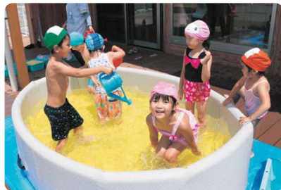
☎ 浪江にじいろこども園 ☎ 0240(25)8619