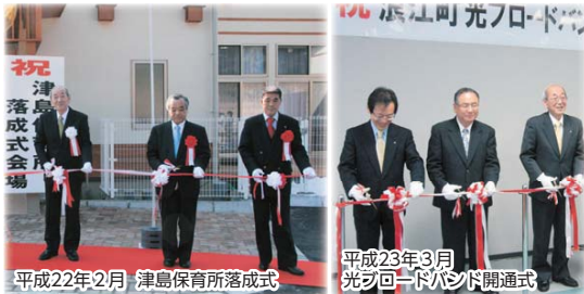
平成22年2月 津島保育所落成式