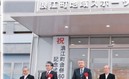
平成28年10月 地域スポーツセンターオープニングセレモニー