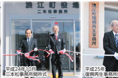
平成24年10月 二本松事務所開所式