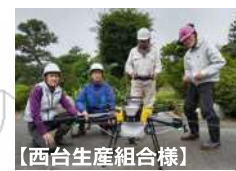
【西台生産組合様】 ドローンの操作訓練