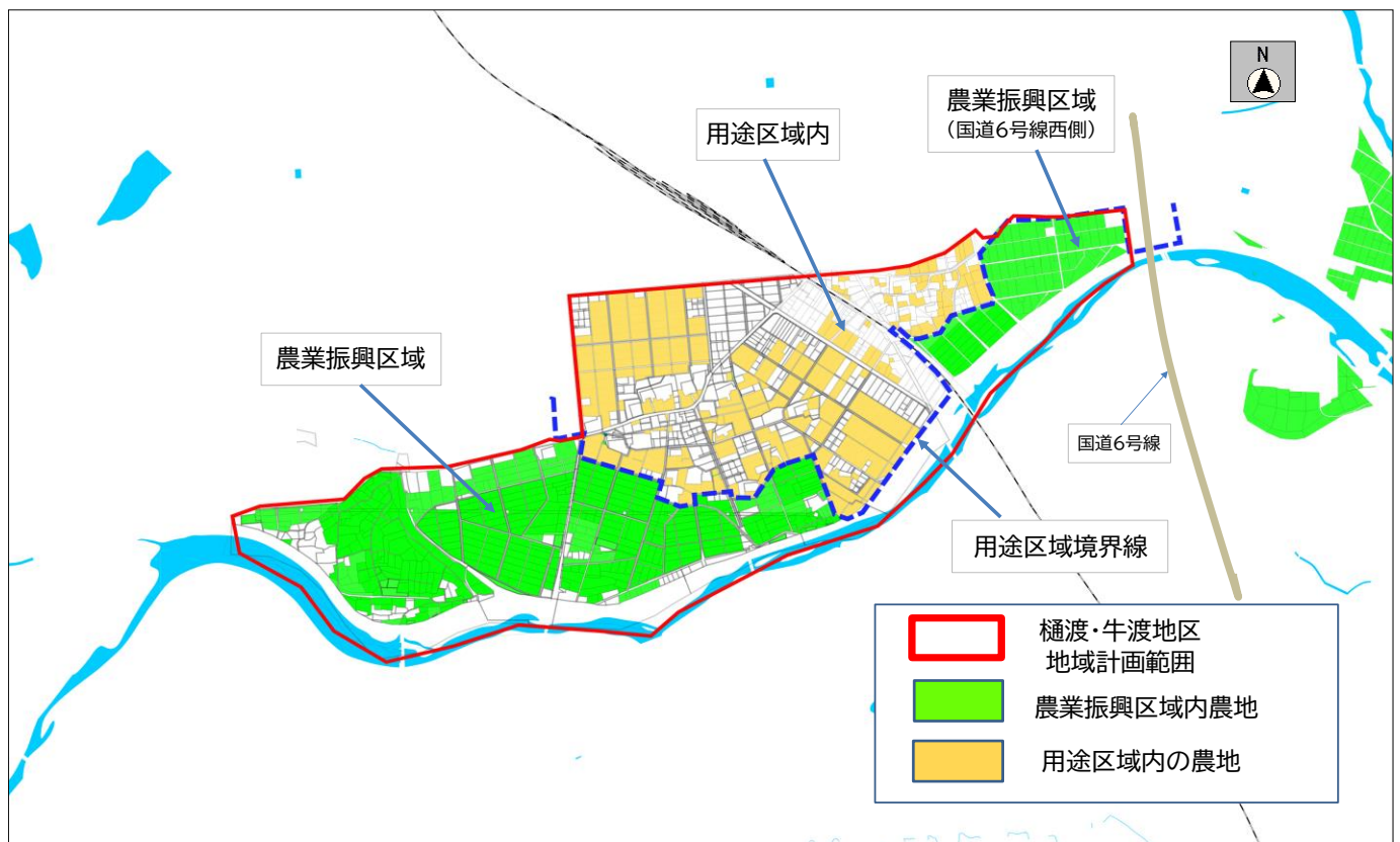
(仮)樋渡・牛渡地区計画策定エリア

■国道6号線から西側の幾世橋地区はこれまで牛渡地区で管理してきた経緯があるので、地域計画に範囲に取り込んでいく。