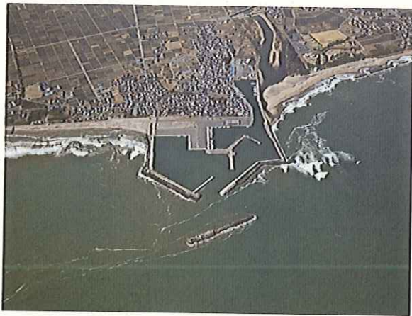
<津波被災前の請戸地区>