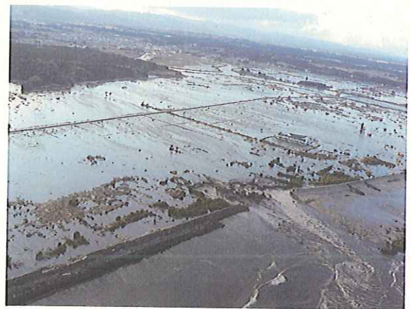
<津波被害直後の請戸地区>