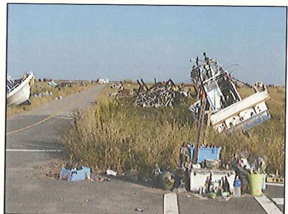
<浜街道から見た請戸地区>