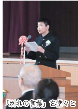
「別れの言葉」を堂々と