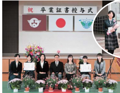
希望を胸に 次なるステージへ