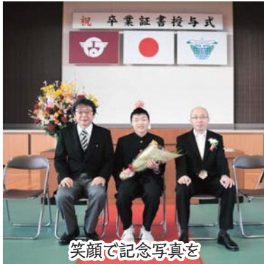
笑顔で記念写真を