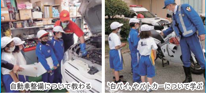
自動車整備について教わる