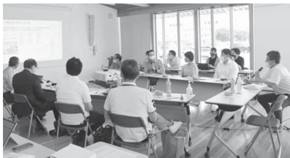
参加者から建設的な意見が続々と

※「なみえスマートモビリティチャレンジ」について詳しくは、「広報なみえ3月号」10・11ページを、内堀福島県知事が実証実験を体験した様子については、「広報なみえ4月号」14ページをご覧ください。