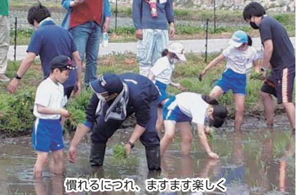
慣れるにつれ、ますます楽しく

5月15日、「第1回 子ども週末チャレンジ」が開催され、「JA福島さくら ふたば地区本部」の協力の下、酒田地区で田植え体験をしました。参加した子供たちは、緊張した面持ちで田植機の運転に挑戦したり、直接田んぼに入り、泥に足を取られ歓声を上げながら苗を植えたりするなど、初めての体験を楽しんでいました。収穫は9月の見通しで、10月に収穫祭を行う予定です。 「子ども週末チャレンジ」では、これからも様々なイベントを計画しています。いつでも申込みが可能ですので、参加を希望する人は、ぜひ、問い合わせください。