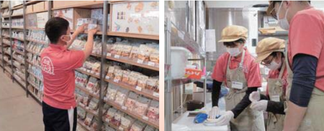
「無印良品」で商品を棚に陳列

「道の駅なみえ」で「職場体験」を行いました。浪江町の魅力がたくさん詰まっている施設で、働く人々と接することができました。生徒たちは、体験を通して仕事の大切さを実感し、地元に対する愛着や誇りをつかみました。将来についての見通しや進路選択のヒントを得た貴重な時間となりました。