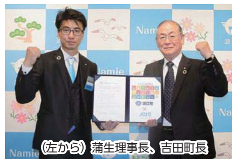
（左から） 蒲生理事長、吉田町長