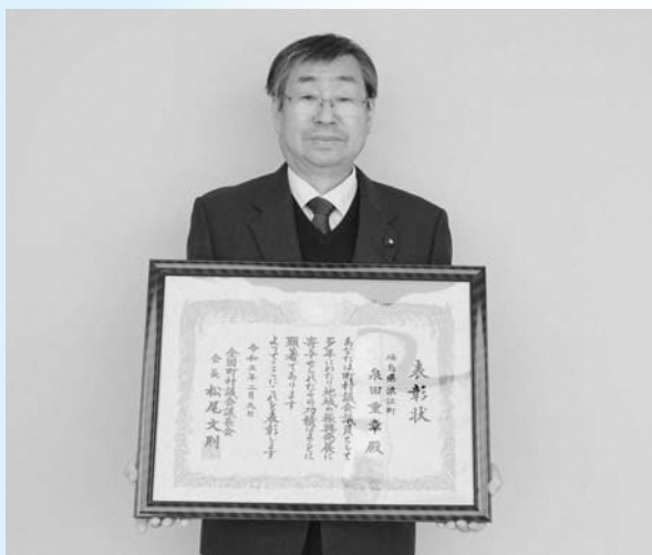
表彰を受けた泉田重章議員