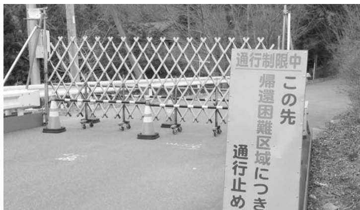
『10年後の現実』、今もゲートで封じられている

でないから駄目という専門家はいません。むしろ、PCR検査を広くやらなければ変異株が蔓延すると言っています。検査拡充が必要ではないのですか。