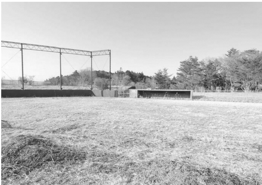
利用できる高瀬球場に

教育次長 浪江町では野球等が盛んで、大堀、高瀬といった施設がそろっており、利用者が多かったと思います。利用を図る方々の意見を聞きながら検討したいと考えています。