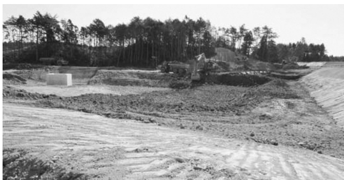
広大な敷地を造成中の南産業団地

答 関係法令に基づき、公園は約5%以上、造成森林（緑地）は約25%以上で計画しています。