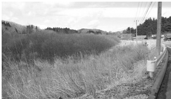
雑木林になってしまった水田