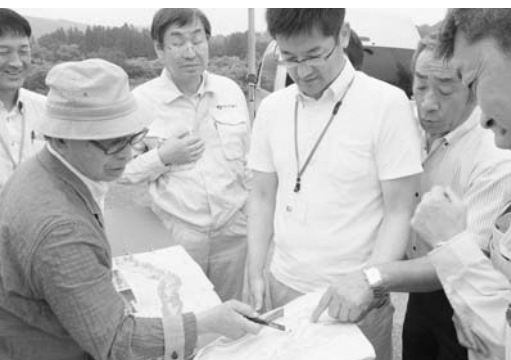
図面を囲み、現地を確認

国道114号は当地方の産業・経済・生活基盤を担うものであり、復興再生の動脈である。未改良箇所も多く、継続して改良整備促進を求めることが重要と考える。