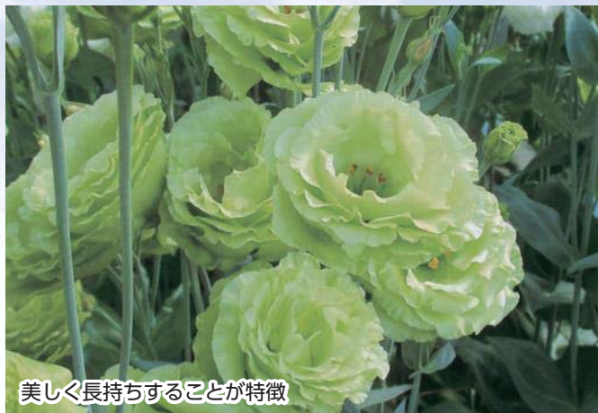
美しく長持ちすることが特徴

平成26年から生産が始まったトルコギキョウが、今年も大輪の花を咲かせました。日照時間が長く、温暖な町の気候を生かして、法人を含む7つの農家で生産が進められています。現在では、東京大田市場などに出荷され、高い評価を得ており、道の駅なみえやJ A福島さくらの農産物直売所でも販売されています。