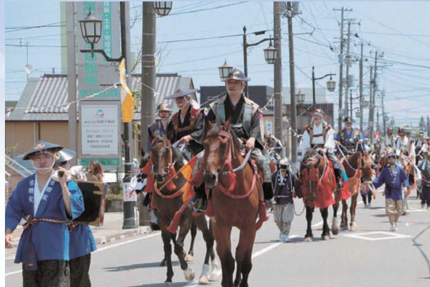
町内を進軍し、凱旋