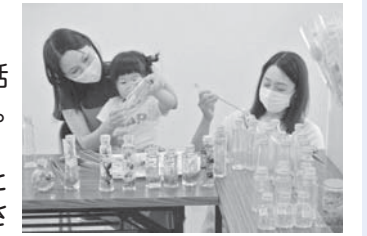
第3回子育てサロンぽかぽかテラス「ハーバリウム体験教室」の様子