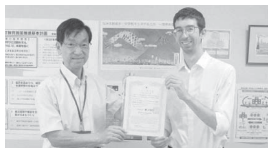
問 教育委員会事務局学校教育係 0240(34)5710