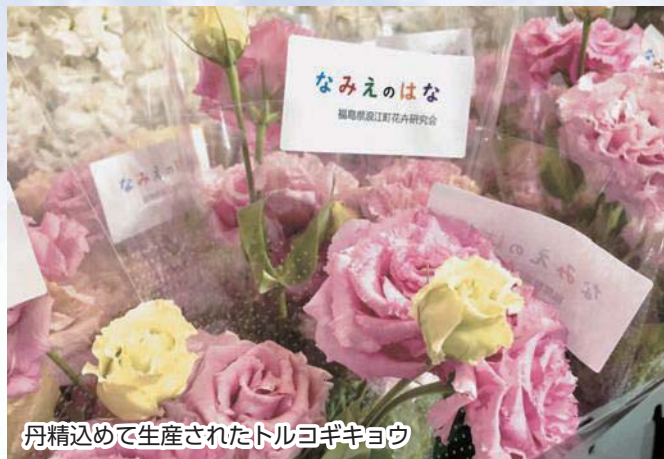
丹精込めて生産されたトルコギキョウ