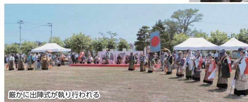
厳かに出陣式が執り行われる