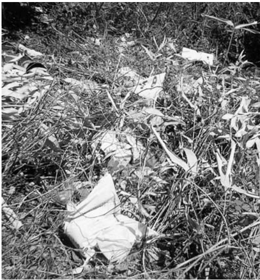
不法投棄ごみの現状

休日に行うことが多い活動への ● 広域圏の受入態勢は ● 粗大ごみ処理、費用の負担は