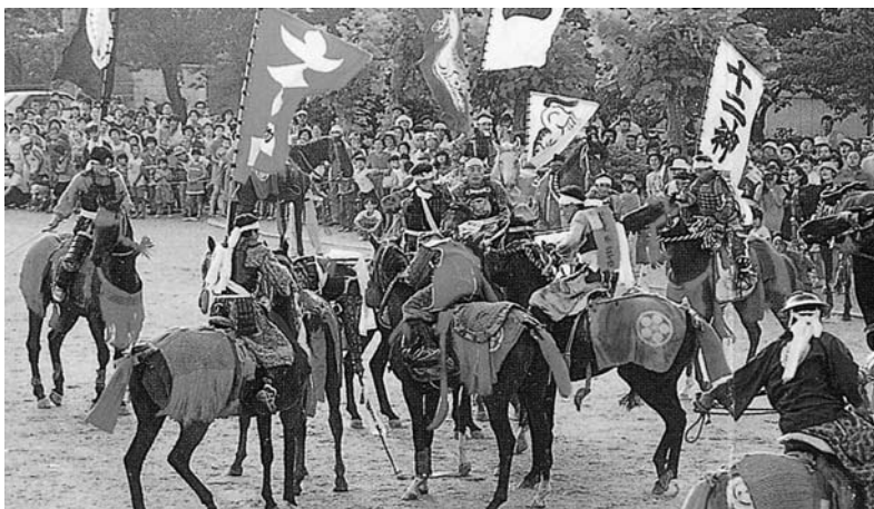
野馬追祭を金・土・日曜日に開催できないか

早期改良を県に対して陳情要望を行っています。南相馬市との共同歩調で取り組みます。