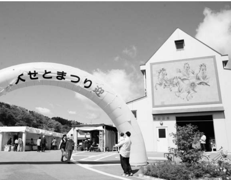
指定管理者の指定を受けた陶芸の杜

公共財産・公共施設の管理は施設によつては指定管理者制度に委ねるという方法を否定するものではありません。