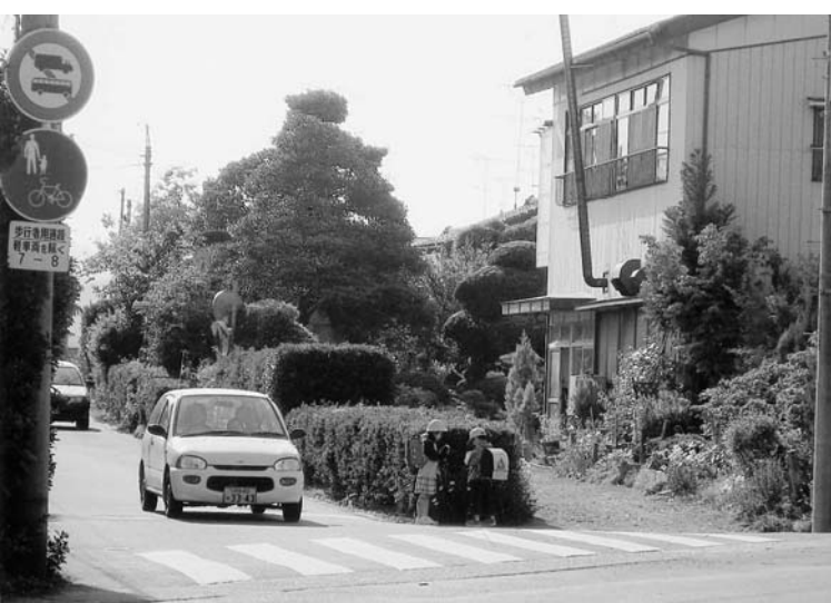
学童・住民の安全のための整備が 陳情された佐野交差点