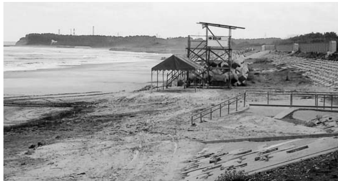
遅々として進まない請戸海水浴場の整備

本年度予算は約10億円。その内、償還金が9億5千万円、残り5千万円が事業費で、用地補償