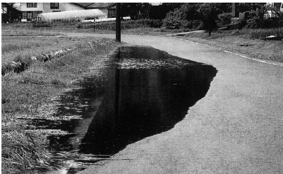
小宮田宮田線(大字西台字谷地内)地盤沈下状況

路盤沈下により、降雨時等交通に支障を来たす状況から、路盤工を含めた改良補修工事を検討してまいります。