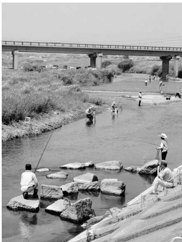
天然鮎が住める川づくりをすすめよう

竹林・雑木の伐採については、要望を受けた箇所を中心に一部実施しております。整地・草刈については、多額の費用が必要ですので場所によって検討を加えながら善処したいと思っております。