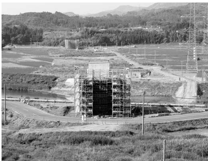
首都圏との交流・間近に迫る常磐道

ておりますが、これからすべからず減ることはあっても増えることはないというのが今の見解であります。やはり私もはその方向に向いてそれを真剣に検討すべきと考えます。