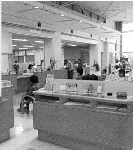
産婦人科の休診について

本院の産婦人科につきましては、患者様に御心配と御迷惑をおかけし、深くお詫びを申し上げます。産婦人科の診療は、今後医師の配置が困難な状況となりましたので、本年三月十日をもって休診いたします。患者様には大変申し訳なく、病院といたしましても誠に残念ではありますが、どうかご理解いただきますようお願いいたします。