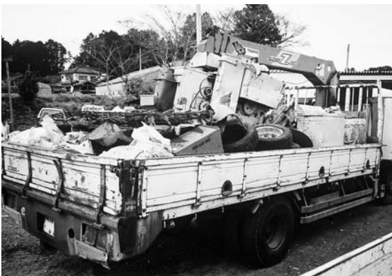
ボランティアが回収した「ゴミの山」

守秘義務の問題や個人情報保護法等の関係もあり難しい問題だと思いますが、慎重に再犯防止には警察等と連携をとり、情報提供を伝達していきたいと考えています。