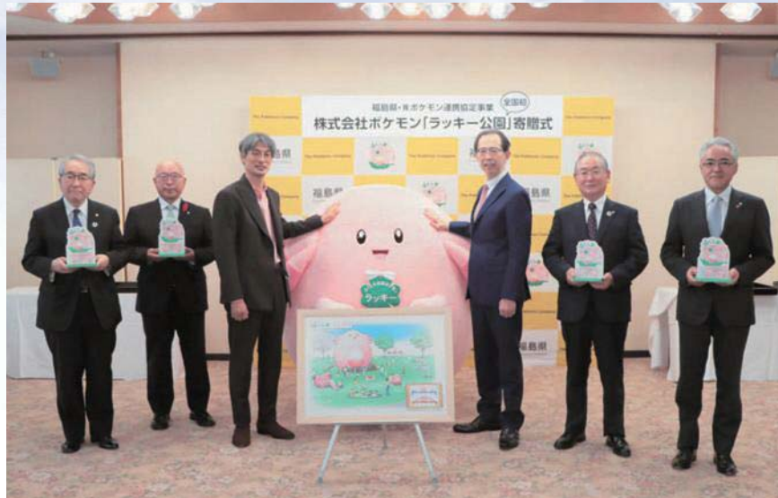
寄贈の様子 (ふくしま応援ポケモン「ラッキー」(中央))