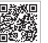
視察の様子はこちら

10月17日、岸田内閣総理大臣が浪江町をはじめ、浜通り地域を視察しました。 岸田総理大臣は、西銘復興大臣、内堀福島県知事、吉田町長が同行の下、はじめに大平山霊園(請戸地区)を訪れ、高台から見える請戸地区について内堀知事、吉田町長の説明を受けました。その後激しい雨の中、浪江町東日本大震災慰霊碑に花を手向けるとともに、黙とうをささげ、犠牲者の冥福を祈りました。 続いて、道の駅なみえに移動し、施設内を視察しました。ここでは道の駅なみえのスタッフから浪江町の産品などの説明を受け、浪江町産の米を手取るなど、終始和やかな雰囲気の中で視察を終えました。 視察後は、道の駅なみえ内において、内堀知事、吉田町長らとともに、浪江町でとれた食材を使った料理を口に、町長らに食材の説明を受けながら非常に美味しいと、絶賛していました。 その後、なみえの技なりわい館において、町の伝統的工芸品である大堀相馬焼などを購入し、出てきた岸田総理大臣は、うけどんや道の駅のスタッフらとグータッチを交わし、施設をあとにしました。