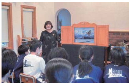
紙芝居「酒田の大堤」

浪江町の復興や再生のために頑張っているみなさんの力を借りて、草木染めや、生徒自身が考えたエゴマを使ったレシピの野外調理などの体験学習を行いました。そのあとは浪江町に伝わる昔話の紙芝居を鑑賞しました。地域の人との交流を通して、郷土への思いを深める行事となりました。