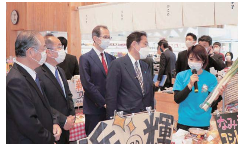
道の駅なみえ視察

10月17日、岸田内閣総理大臣が浪江町をはじめ、浜通り地域を視察しました。 岸田総理大臣は、西銘復興大臣、内堀福島県知事、吉田町長が同行の下、はじめに大平山霊園(請戸地区)を訪れ、高台から見える請戸地区について内堀知事、吉田町長の説明を受けました。その後激しい雨の中、浪江町東日本大震災慰霊碑に花を手向けるとともに、黙とうをささげ、犠牲者の冥福を祈りました。 続いて、道の駅なみえに移動し、施設内を視察しました。ここでは道の駅なみえのスタッフから浪江町の産品などの説明を受け、浪江町産の米を手取るなど、終始和やかな雰囲気の中で視察を終えました。 視察後は、道の駅なみえ内において、内堀知事、吉田町長らとともに、浪江町でとれた食材を使った料理を口に、町長らに食材の説明を受けながら非常に美味しいと、絶賛していました。 その後、なみえの技なりわい館において、町の伝統的工芸品である大堀相馬焼などを購入し、出てきた岸田総理大臣は、うけどんや道の駅のスタッフらとグータッチを交わし、施設をあとにしました。