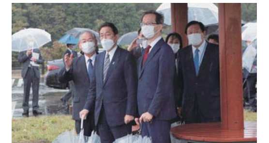
請戸地区について説明