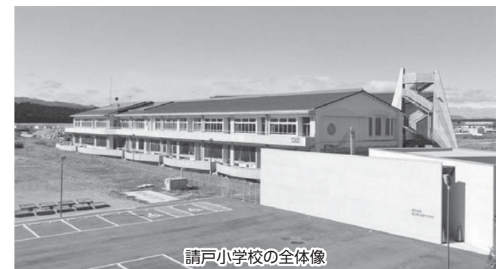
請戸小学校の全体像