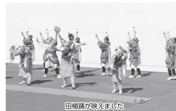
田植踊が映えました