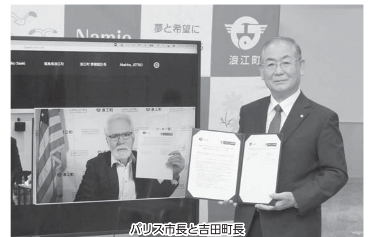
パロイス市長と吉田町長