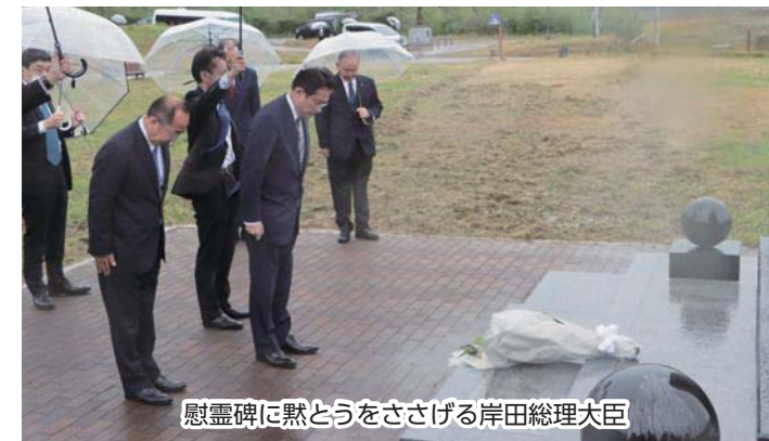
慰霊碑に黙とうをささげる岸田総理大臣