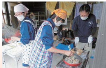
野外調理「エゴマを使った料理」