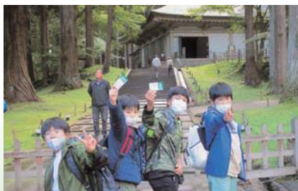
中尊寺「藤原氏三代ゆかりの寺」