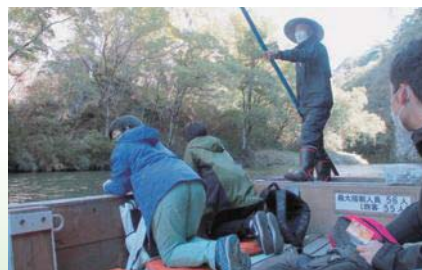
狛鼻溪舟下り「石灰岩の岸壁」