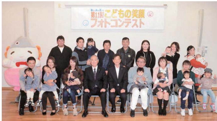
満面の笑みの親子たち

「第11回こどもの笑顔フォトコンテスト」を開催したところ、64点の作品の応募があり、15作品が入賞。