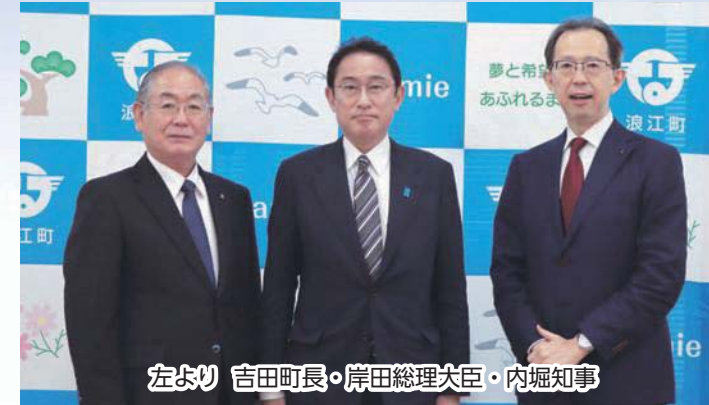
左より 吉田町長・岸田総理大臣・内堀知事