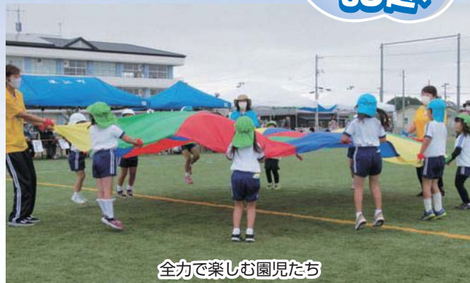
全力で楽しむ園児たち

10月9日、なみえ創成小学校・中学校・浪江にじいろこども園の合同運動会を行いました。昨年は雨のため体育館での開催でしたが、今年は校庭で運動会を実施。広い校庭をめいっぱい駆け回りました。