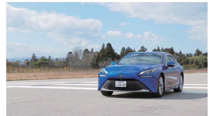
新型ミライ同乗体験