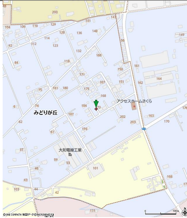
(11)配置図・間取り図