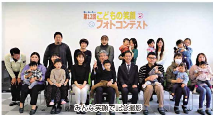
みんな笑顔で記念撮影