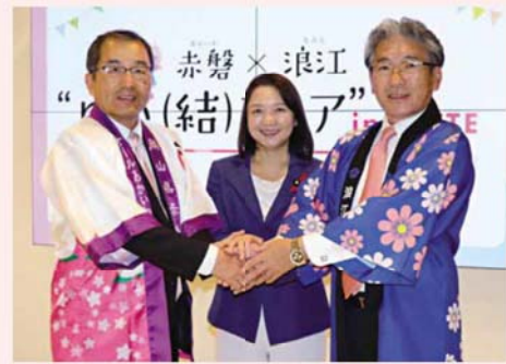
竹谷とし子復興副大臣(中央)と友實武則赤磐市長(左)と吉田栄光町長(右)

岡山県赤磐市と浪江町は、平成23年の震災以降、職員派遣などの災害復興支援を契機に交流を続けていますが、今後も継続し相互の地域発展に取り組みます。