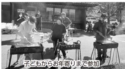
子どもからお年寄りまで参加

また、今年新たに発足した請戸住宅団地『海の見える丘自治会』では、10月2日(日)、初のイベントを開催し、福島いこいの村なみえにおいてバーベキューを楽しみました。