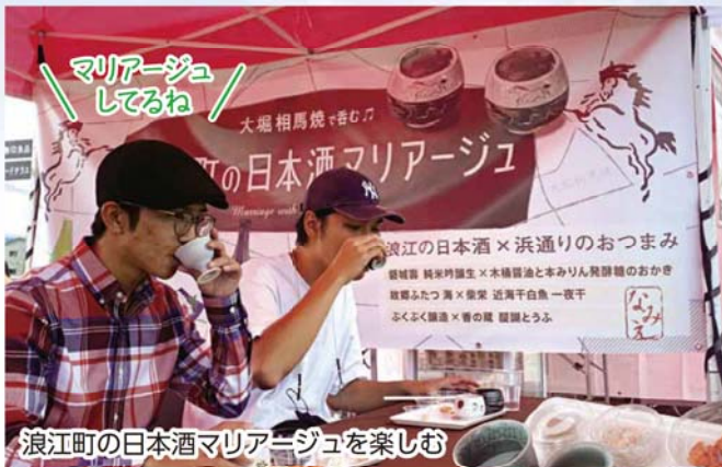
浪江町の日本酒マリアージュを楽しむ