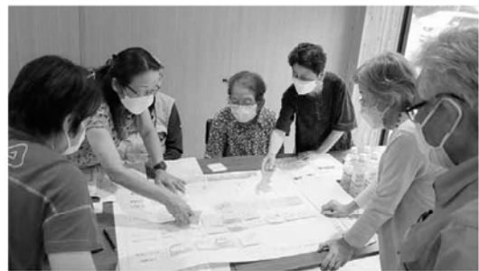
テーブル毎、防災の意見交換を実施