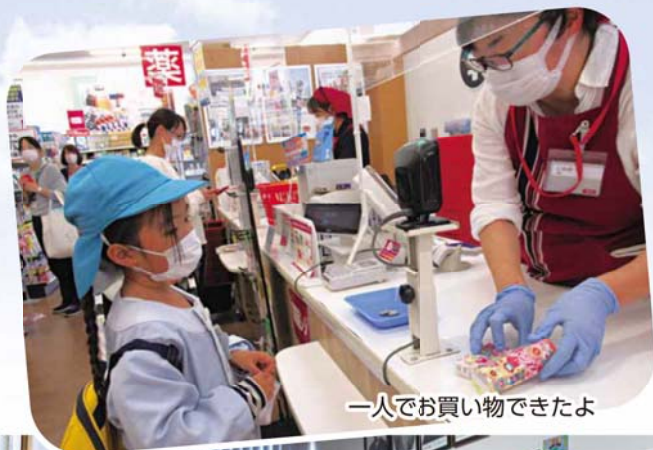
一人でお買い物できたよ

浪江町のたくさんのお仕事に興味を持ち、たくさんの方が働いていることがわかりました。