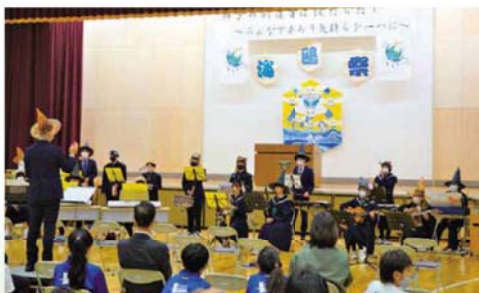
生徒と先生による合奏「ツバメ」

なみえ創成中学校の文化祭 第1回「海鷗祭」を行いました。生徒たちは短い期間の中、協力して準備や練習に取り組んできました。当日、会場内の展示スペースには各教科の作品が展示され、ステージでは代表生徒による作文、文化部の動画、各学年の総合学習などの発表が行われました。海鷗祭の最後は生徒と先生による合奏「ツバメ」が披露され、会場全体がひとつになって盛り上がりました。「海鷗祭」の名称は、町の鳥の象徴「カモメ(鷗)」のように、力強く、力強さをもって前進する文化祭になるよう願いが込められています。