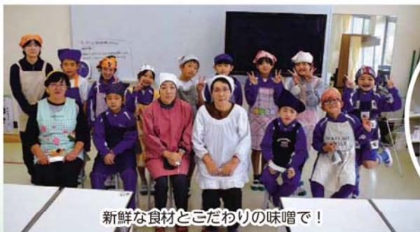
新鮮な食材とごだわりの味噌で！

包丁を持って野菜を切る体験は、ちょっぴり緊張したようです。みんなで作った紅葉汁は格別で、とても美味しいものでした。