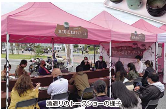
酒造りのトークショーの様子

10月8日(土)・9日(日)、道の駅なみえにおいて地元の日本酒と大堀相馬焼の魅力に触れてもらうイベントを開催しました。