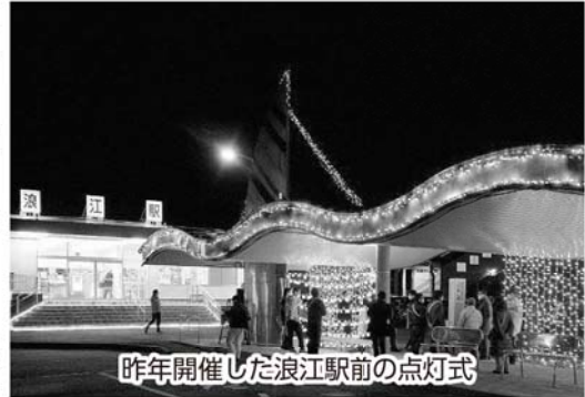
昨年開催した浪江駅前の点灯式

12月6日(火)、17時45分から浪江駅前において点灯式が開催されます。鮮やかな光で彩られた駅前にぜひお越しください。