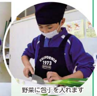
野菜に包丁を入れます