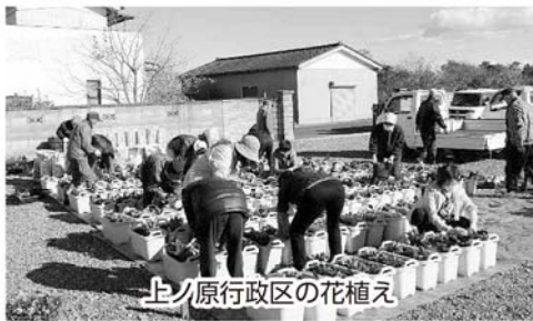
上ノ原行政区の花植え

高瀬や川添、樋渡・牛渡の行政区では、地域の拠り所である神社仏閣が再建されたことで、盆踊りや例大祭などの地域行事が復活する動きがあり、震災と原発事故以前に見られた季節の風景が戻りつつあります。また、近年では、移住した人も積極的に地域の輪に入り、地域を支える姿が見られるようになりました。