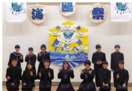
第1回 海鷗祭、力を合わせて頑張りました