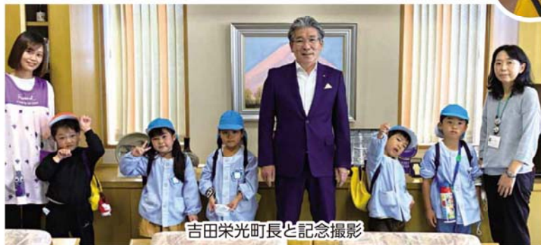
吉田栄光町長と記念撮影