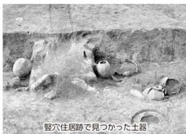
竪穴住居跡で見つかった土器