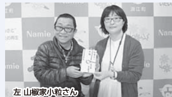
左 山椒家小粒さん