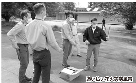
追い払い花火実演風景