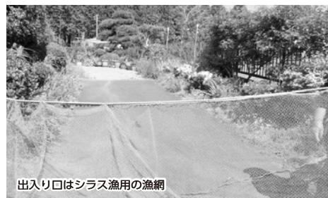
出入り口はシラス漁用の漁網

■加害獣種を教えてください ニホンザルによる被害です。 ■いつから、どんな被害がありましたか？ 帰還当初からサルは近隣に出没しており、当時はカキの実を食べていました。家庭菜園をはじめて一年後からニホンザルによる被害が出始めました。カボチャやナスを中心に植えたものはすべて被害にあっていました。