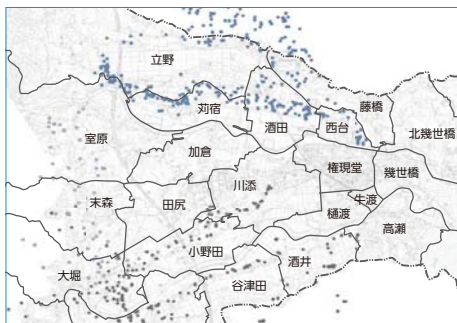
ニホンザル群れの行動圏 2022年8月の出没状況

町内に生息するサルの群れは、捕獲事業や環境整備の結果、以前よりも人に警戒心を抱いています。また、被害を減らすためには、群れの行動圏を私たちの生活圏から離す必要があります。 講習会では、群れを生活圏に寄せ付けないポイントや、追い払い花火取扱いの注意点について話し合いました。