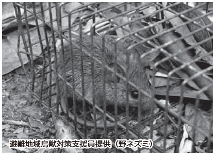
(野ネズミ)