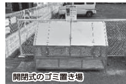
開閉式のゴミ置き場

そのための、空き家にエサとなるごみを置かないよう呼びかけました。そのほかにも、開閉式のゴミ置き場に換え、鳥獣の被害が減るようにしました。今後も住み続けられる町を目指して、地域づくりと鳥獣対策を継続していきたいです。