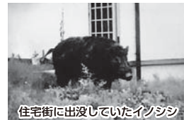
住宅街に出没していたイノシシ

令和4年度以降、イノシシの捕獲頭数が減少するとともに、被害報告も大きく減少しています。捕獲隊が大型のメス個体を多く捕獲したことや、町民の皆さんの丁寧な鳥獣対策の効果が大きく、そのほかにも豚熱の蔓延が影響していると考えられます。今回は皆さんの鳥獣対策とイノシシの出没状況とその被害を調査をしました。