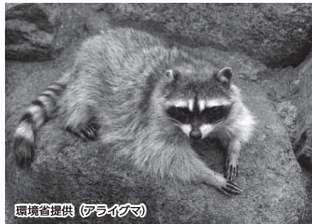
(アライグマ)