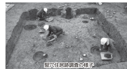
竪穴住居跡調査の様子