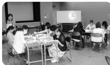
(左) 7月2日 福島市リフレッシュママ