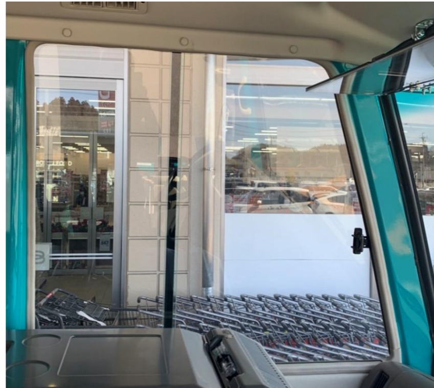
ベシア安達店 (店舗出入り口付近)