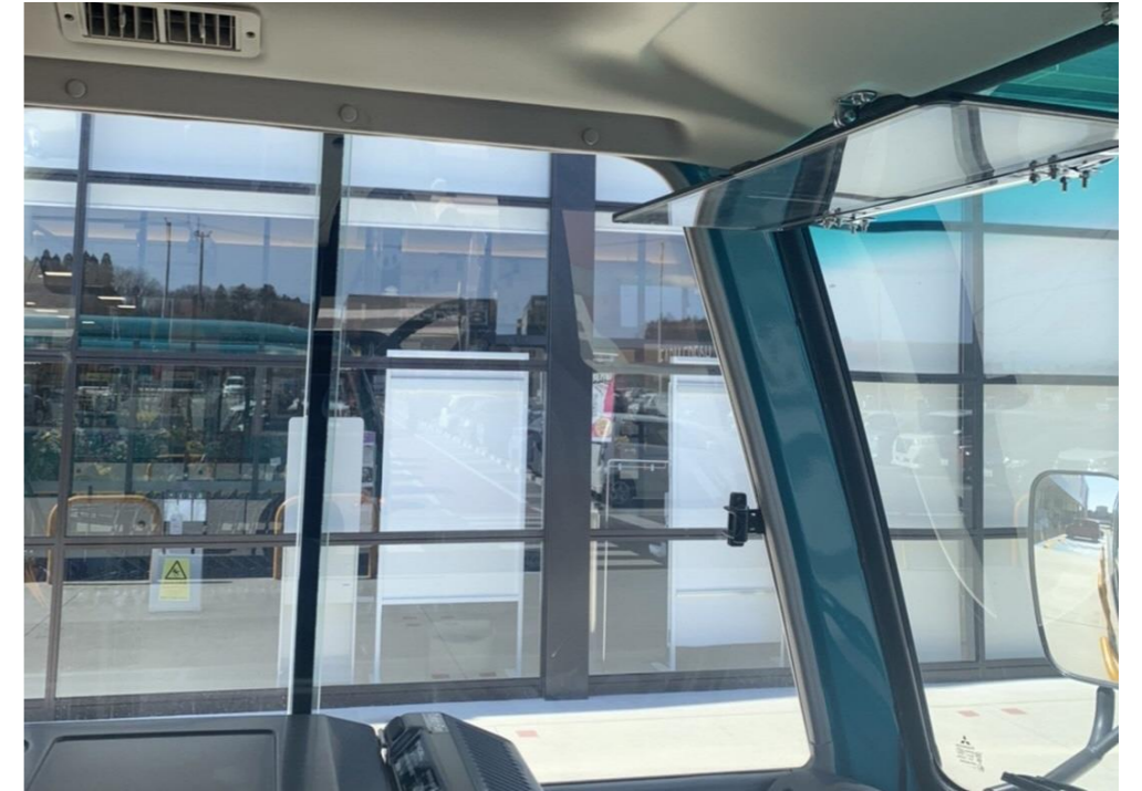
メガステージ二本松