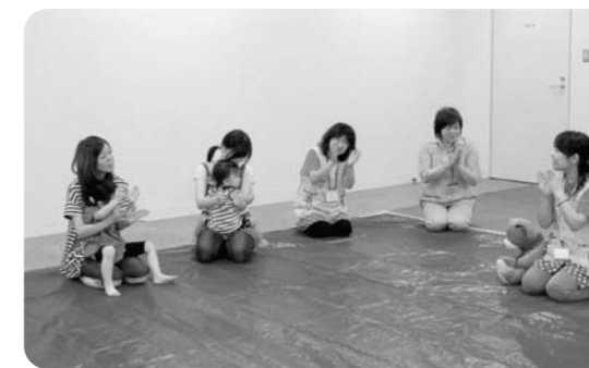
△8月28日、郡山市 保育士さんの歌に合わせて楽しく手あそびをします。