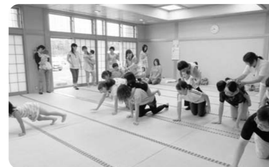
△8月23日、いわき市 ママの背中について「よーい、ドン!」だれが一番早いかな?!