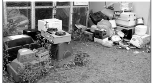
町内某所で不法投棄されている不燃ごみ

また、放射性物質の拡散に繋がってしまうため、浪江町内のごみは町外へ持ち出さないよう、あわせてお願いします。