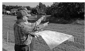
※農地パトロール員は身分証を所持し、緑色の帽子を着用しています。

農地の適正な管理を怠ると、雑草の繁茂による病害虫の発生や鳥獣が住み着くなど、近隣の迷惑となる恐れがあります。農地の管理は、農地法において所有者の責務として規定されていますので、適正な管理をお願いします。