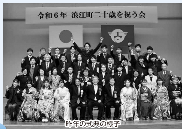
昨年の式典の様子