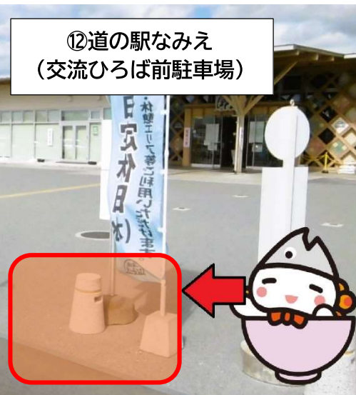
⑫ 道の駅なみえ (交流ひろば前駐車場)