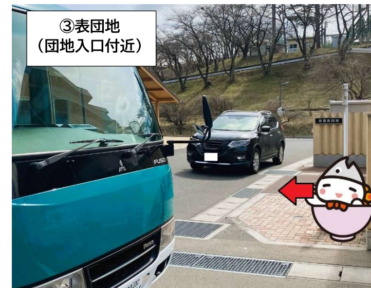
③ 表団地 (団地入口付近)