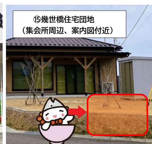
⑮ 幾世橋住宅団地 (集会所周辺、案内図付近)