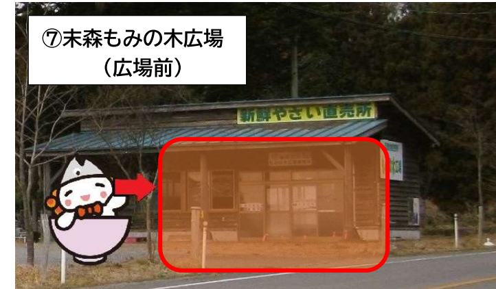
⑦ 末森もみの木広場 (広場前)