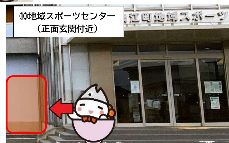
⑩ 地域スポーツセンター (正面玄関付近)