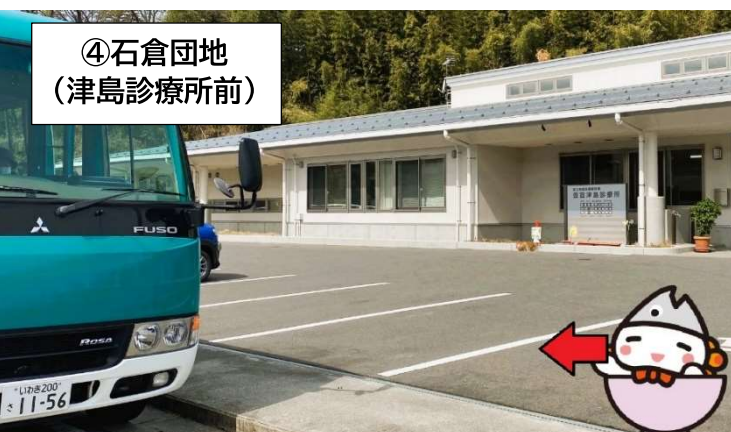
④ 石倉団地 (津島診療所前)