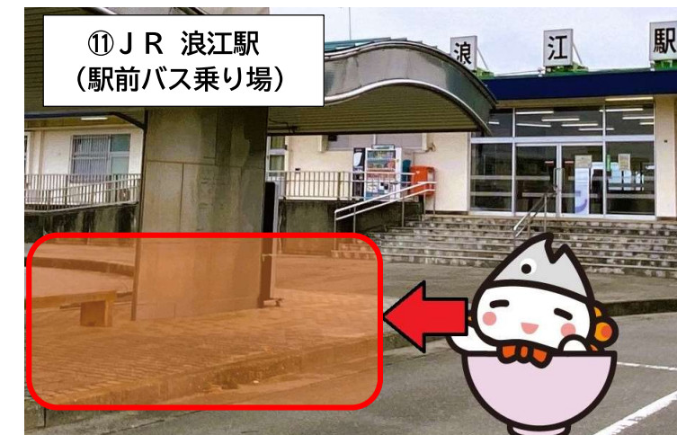
⑪ J R 浪江駅 (駅前バス乗り場)