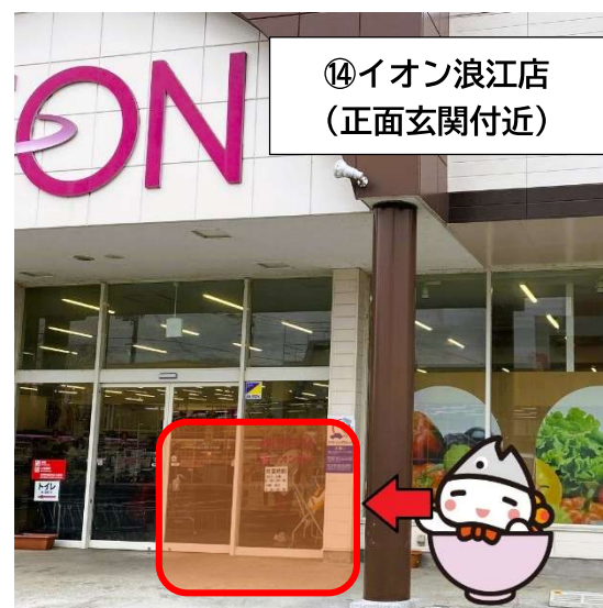
⑭ イオン浪江店 (正面玄関付近)