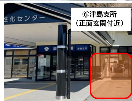
⑥ 津島支所 (正面玄関付近)