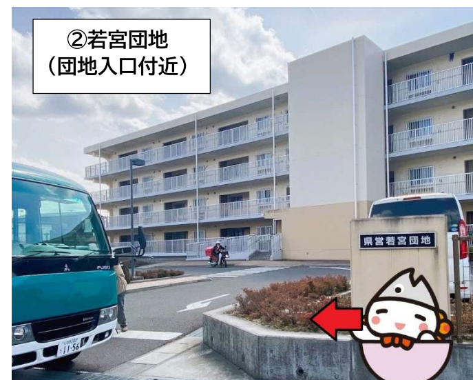
② 若宮団地 (団地入口付近)