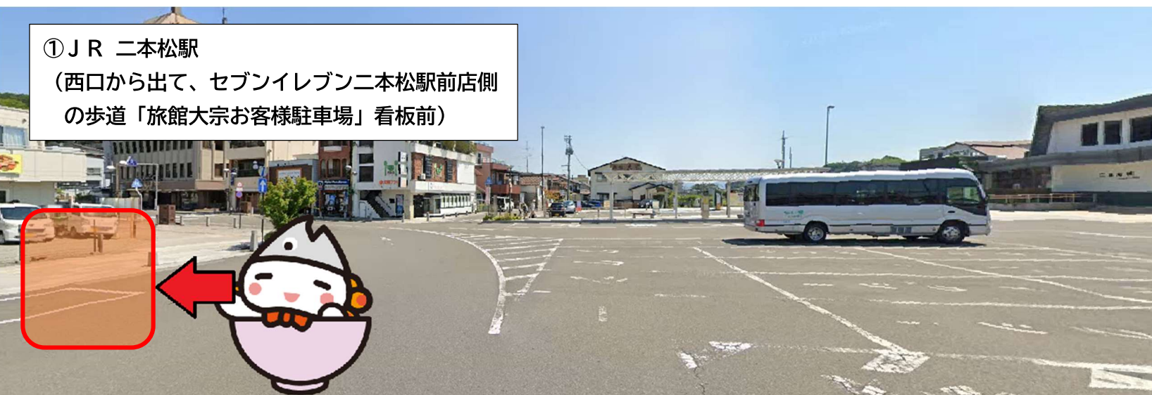
① J R 二本松駅 (西口から出て、セブンイレブン二本松駅前店側 の歩道「旅館大宗お客様駐車場」看板前)