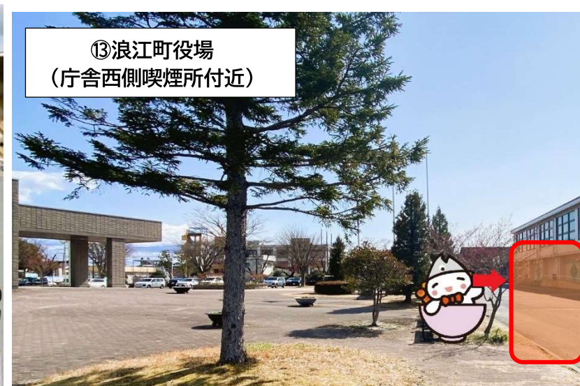
⑬ 浪江町役場 (庁舎西側喫煙所付近)