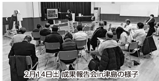
2月14日(土) 成果報告会 in 津島の様子

※リスクコミュニケーションとは、放射線などのリスクに関して住民や関係者間で情報や意見を共有し、対話を通じて理解を深め、信頼関係を築いていく活動