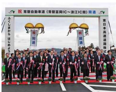
常磐自動車道開通