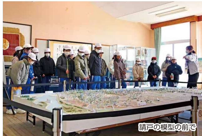
請戸の模型の前で

また、今回は10名の保護者にもご参加いただき、学校と家庭、そして地域が一体となって防災意識を高める貴重な機会となりました。