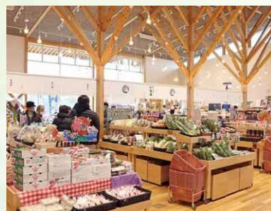
道の駅なみえオープン