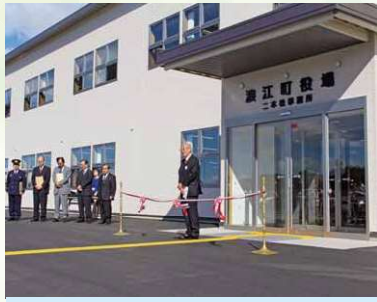
役場二本松事務所