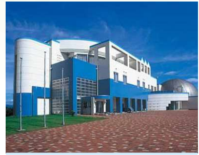
マリパークなみえ