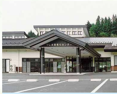
津島活性化センター