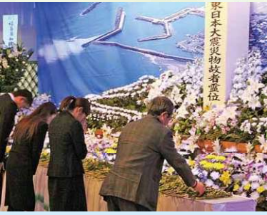
町内で追悼式・慰霊祭