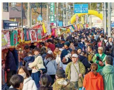
新町通りでの十日市祭