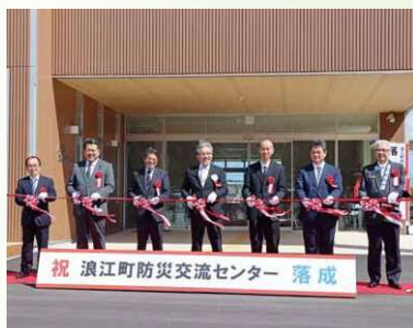
防災交流センター落成