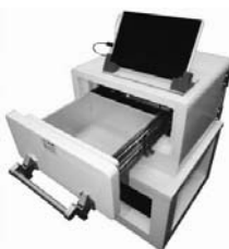
テクノエックス製 レギューム・ライト