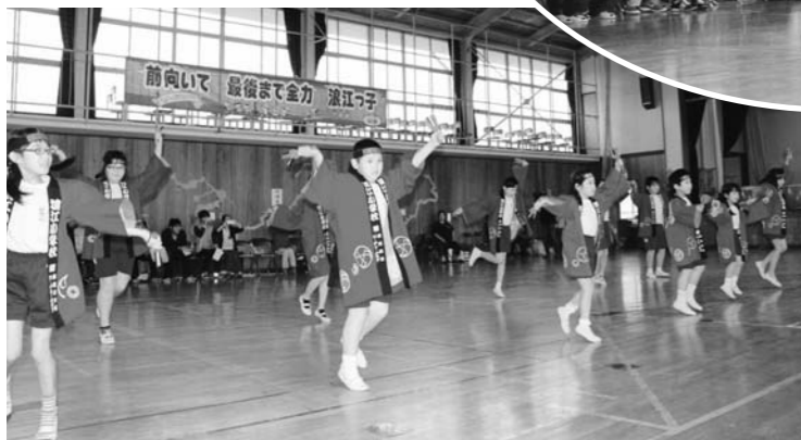
ザ、浪江っ子よさこい! ここからは広告です。