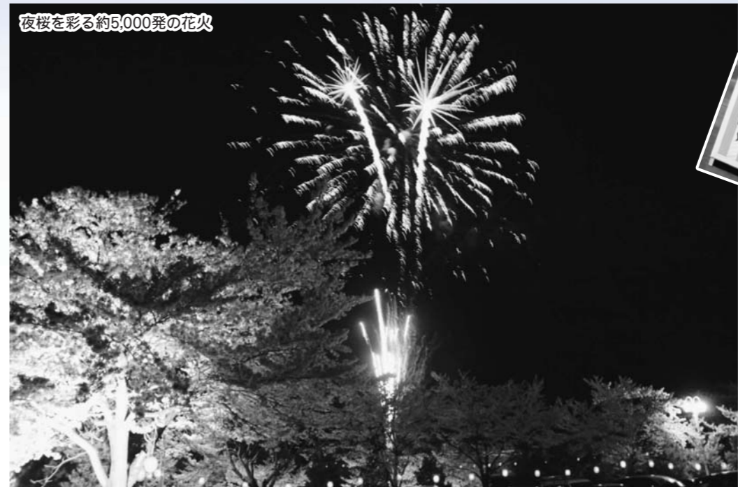
夜桜を彩る約5,000発の花火