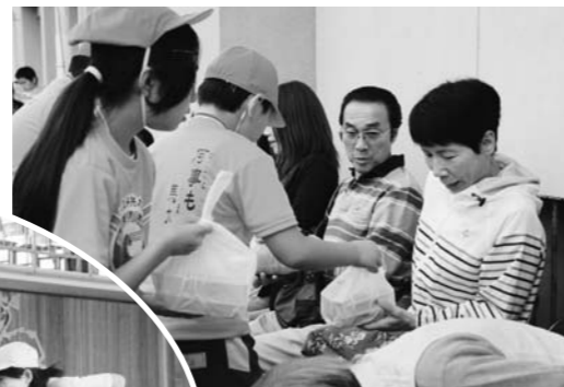
「浪江子供大使」のTシャツを着て、なみえ焼そばを来場者一人ひとりに手渡す児童たち