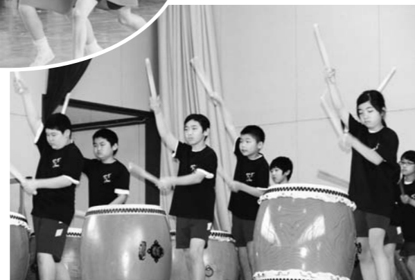
心に響く！和太鼓演