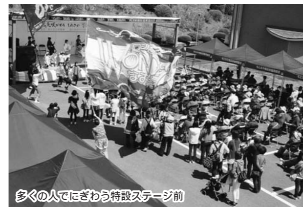
多くの人でにぎわう特設ステージ前

本宮市には現在、700名余りの浪江町民が暮らしています。本宮市の皆さん、ありがとうございました。