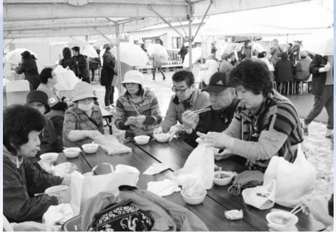
多くの来場者でにぎわう会場

復興祭の最後には、同仮設へ物資の支援をいただいている熊本県の大鳥屋さんから届いた柑橘類が来場者に配られ、大盛況のうちに幕を閉じました。