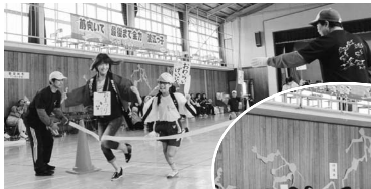
なかくよく変身 (親子競技)

競技終了後には、浪江焼麺太国の皆さんによるなみえ焼そばが振る舞われ、「浪江子供大使」の児童たちが、来場者一人ひとりに感謝の気持ちを込めて、出来立ての温かいなみえ焼そばを手渡しました。