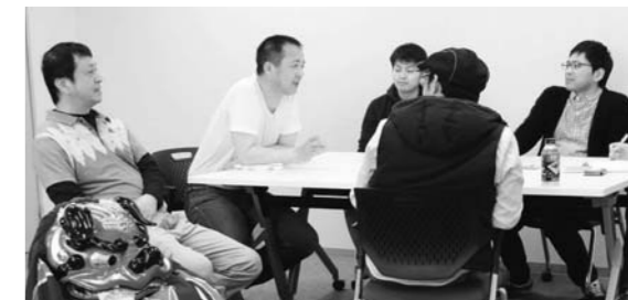
▲取材当日、初めての話が飛び出したり、それぞれの思いが語られたり、賑やかなインタビューとなりました。