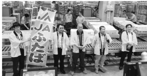
大田市場で双葉郡の花弁のPRを行うNPO法人Jin川村さん(右から2人目)

いるもので、農協を通じて東京大田市場に出荷されました。7月15日の競りの前には、Jin