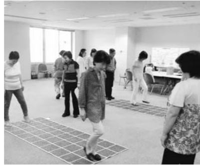
食後の軽い運動は、血糖値を下げるのに効果的です。

広報なみえ7月号で紹介した「知って得する!! 健康お役立てセミナー」第2回目を開催しました。