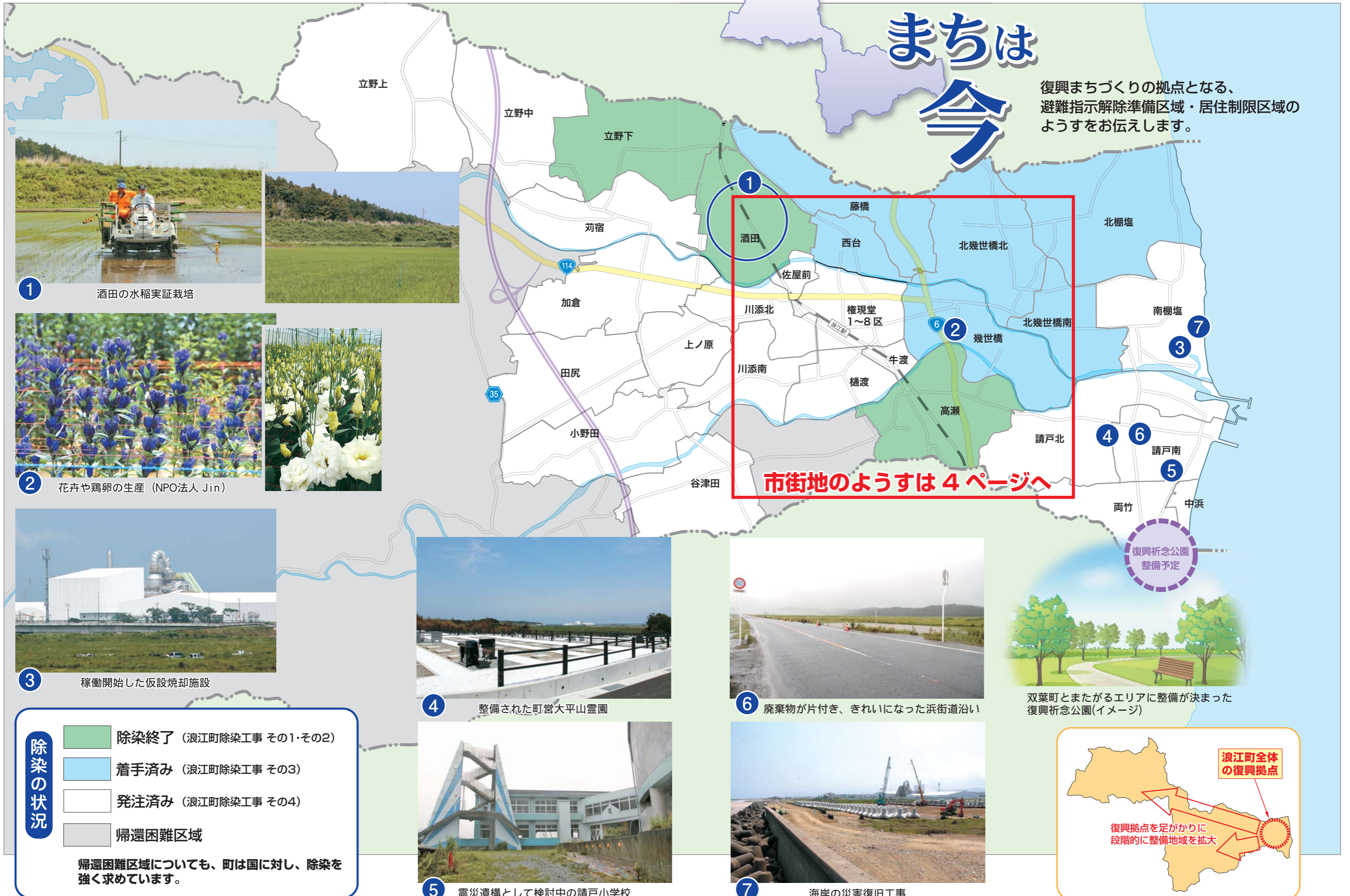
1 酒田の水稲実証栽培

復興まちづくりの拠点となる、 避難指示解除準備区域・居住制限区域の ようすをお伝えします。