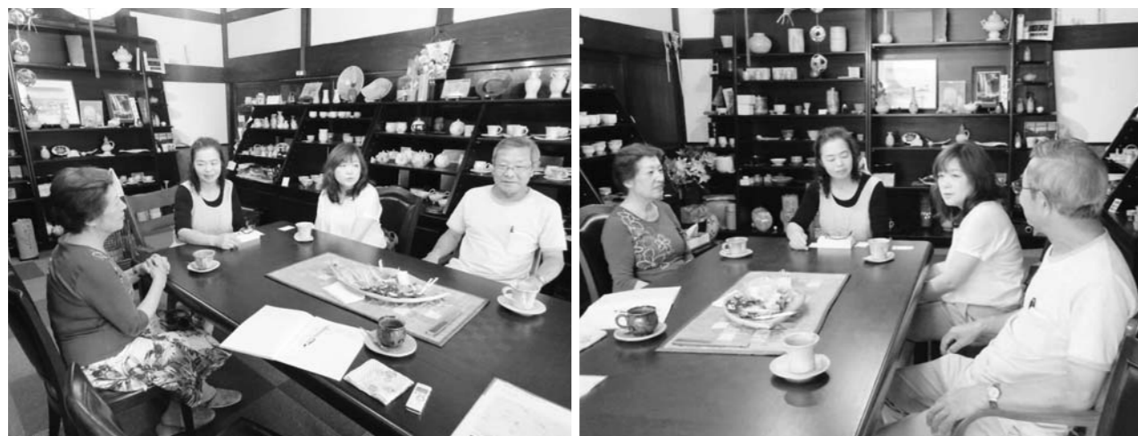
▲みなさんのお話はいつまでも尽きませんでした。 ここには、いつもこんな風に穏やかな時間が流れているのでしょう。

宇佐美 近所に土地を求めると「京月窯」が近くにあることを知りませんでした。また、知り合いが数軒あることも分かりましたので、見知らぬ土地ですが何とか慣れ親しんでいきたいと思っています。