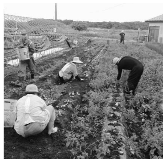
「営農再開をめざす会」によるジャガイモ収穫の様子

浪江町「営農再開をめざす会」が6月28日、北幾世橋地区でジャガイモの収穫を行いました。「営農再開をめざす会」は、平成25年度から継続して野菜の試験栽培を実施し、安全性の試験を行ってまいりました。ジャガイモは、ローソ