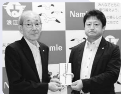
6月22日、埼玉県鳩ヶ谷ライオンズクラブ様