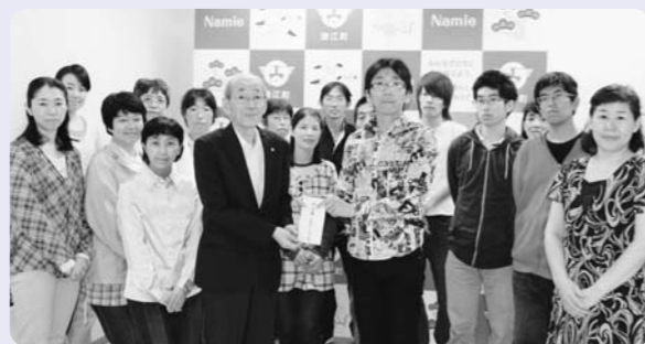
6月19日、日本ボランティア会様