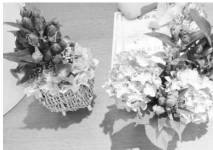
「なみえフェア」にて、リンドウがアジサイなどの花とアレンジされていました。