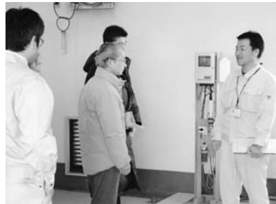
現地視察の様子（谷津田取水場）