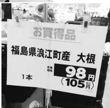
南相馬市のヨークベニマル原町西店で販売される浪江産のダイコン

これからの農産物は、幾世橋地区で野菜等の栽培を行っているNPO法人Jinが生産しているもので、県による放射性物質の検査により安全性が確認されています。