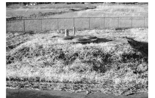
谷津田取水場(水源井戸)