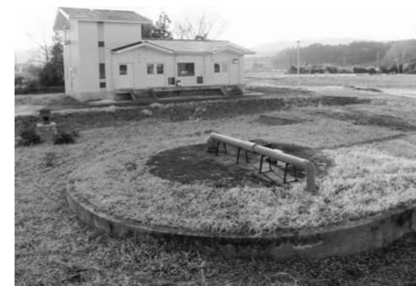
谷津田取水場(全景)

上水道の供給を行うにあたり、より一層、安心・安全にお使いいただけるように努めていきます。