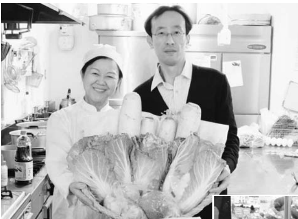
浪江産のダイコンなどを手にするNPO法人ワーカーズコープの職員。 ※写真のハクサイは、南相馬産のもので、浪江町のハクサイは、現在、摂取・出荷が制限されています。

南相馬市にある「ヨークベニマル原町西店」では、1月下旬から浪江産のダイコンが販売されました。売れ行きは順調で、お一人で5本購入された方もいたそうです(出荷量には限りがありません)。