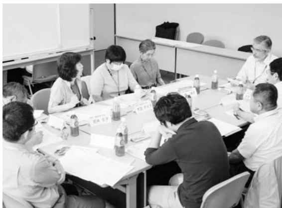
復興計画策定委員会

町長 度重なる行政活動、要望活動をしているなかで、賠償が一つの正念場だと考えています。復興大臣が来町の予定になっていますので、激しい議論を交わしながら頑張っていきたいと思っております。