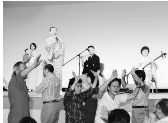
県外で開催された懇談会、交流会（椿山荘）

質問 県外避難者との懇談会の計画はあるのか。 生活支援課長 今後17都道府県で交流会の開催計画があり、その中で相談コーナー、情報・意見交換を行う予定があります。