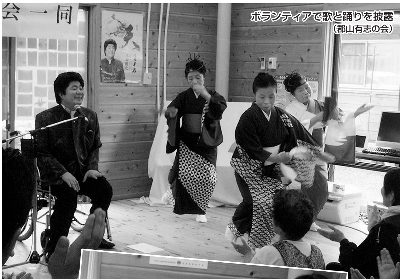
ボランティアで歌と踊りを披露 (郡山有志の会)