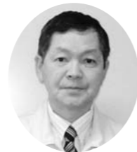
愛澤 格 議員