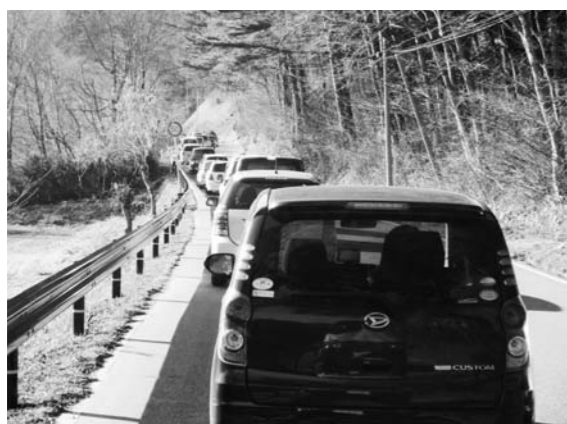
3月12日 津島地区に避難する車両