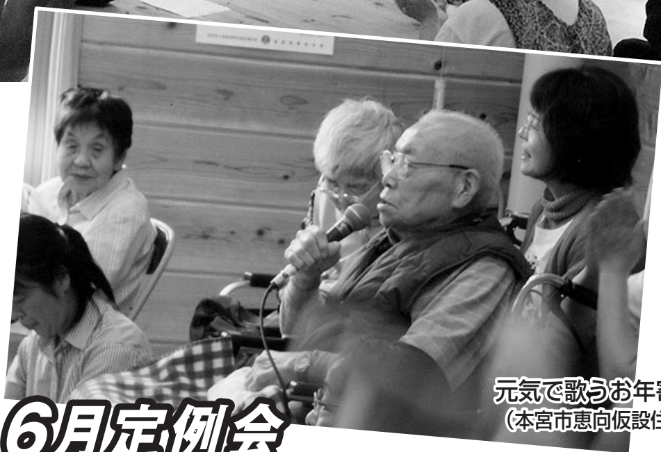
元気で歌うお年寄り (本宮市恵向仮設住宅)