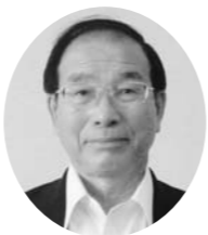
馬場 績 議員