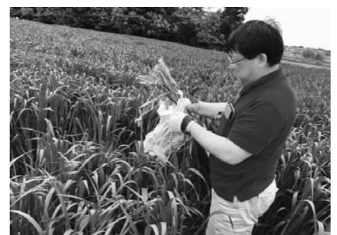
栽培中の牧草の様子

を北棚塩地区で実施しています。4月に播種を行った燕麦については、6月に安全確認と鋤き込みを行い、後作としてオーチャードとイタリアンの播種を行う予定です。