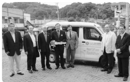
福島中央ロータリークラブ様、二本松ロータリークラブ様、米国ニューポート・バルボアロータリークラブ様から軽自動車1台を寄贈していただきました。