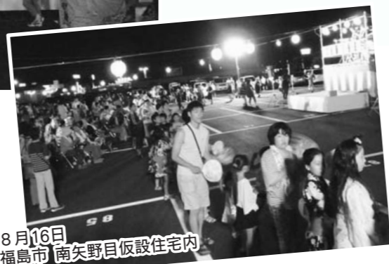
8月16日 福島市 南矢野目仮設住宅内