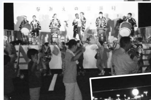
8月14日 本宮市 石神第二仮設住宅内

浪江町の文化である盆踊りが、二本松市内や仮設住宅等で開催され、ふるさとの復興に向けて思いをひとつにしました。