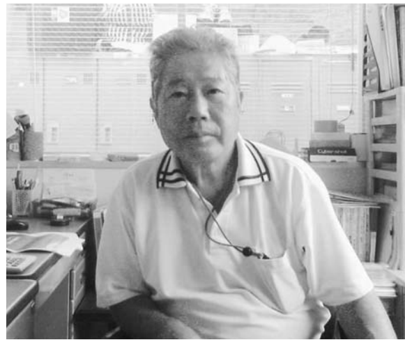
▲「森林ボランティアを再開したら、また取材に来てくださいね。」と話してくださいました

原発事故は人災かもしれないが、お互いに理解しながら、復興に向けて困難な課題を解決して欲しいとおっしゃっていました。