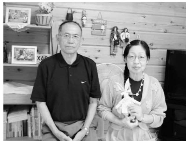
▲夫 仁さんと一緒に、作品を手にして。

べた作品を撮影してくださいました。その写真は、今では私の一番の宝物です。また、2月に取材を受けたNHK「すてきにハンドメイド」の放映は避難先で観ました。叶うならば、自宅で以前のように作品作りを楽しんだり、時にはお教えしたりしたいです。夫と2人、帰町へのあわい期待とふるさとへの愛着を抱きつつ、一日も早い結論を今か今かと待つ毎日を送っています。