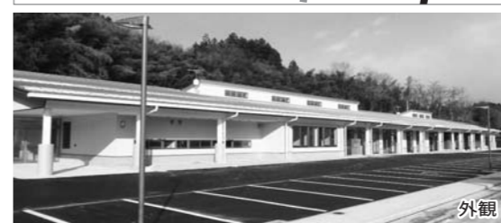
☎ 仮設津島診療所 ☎ 0243(24)1431