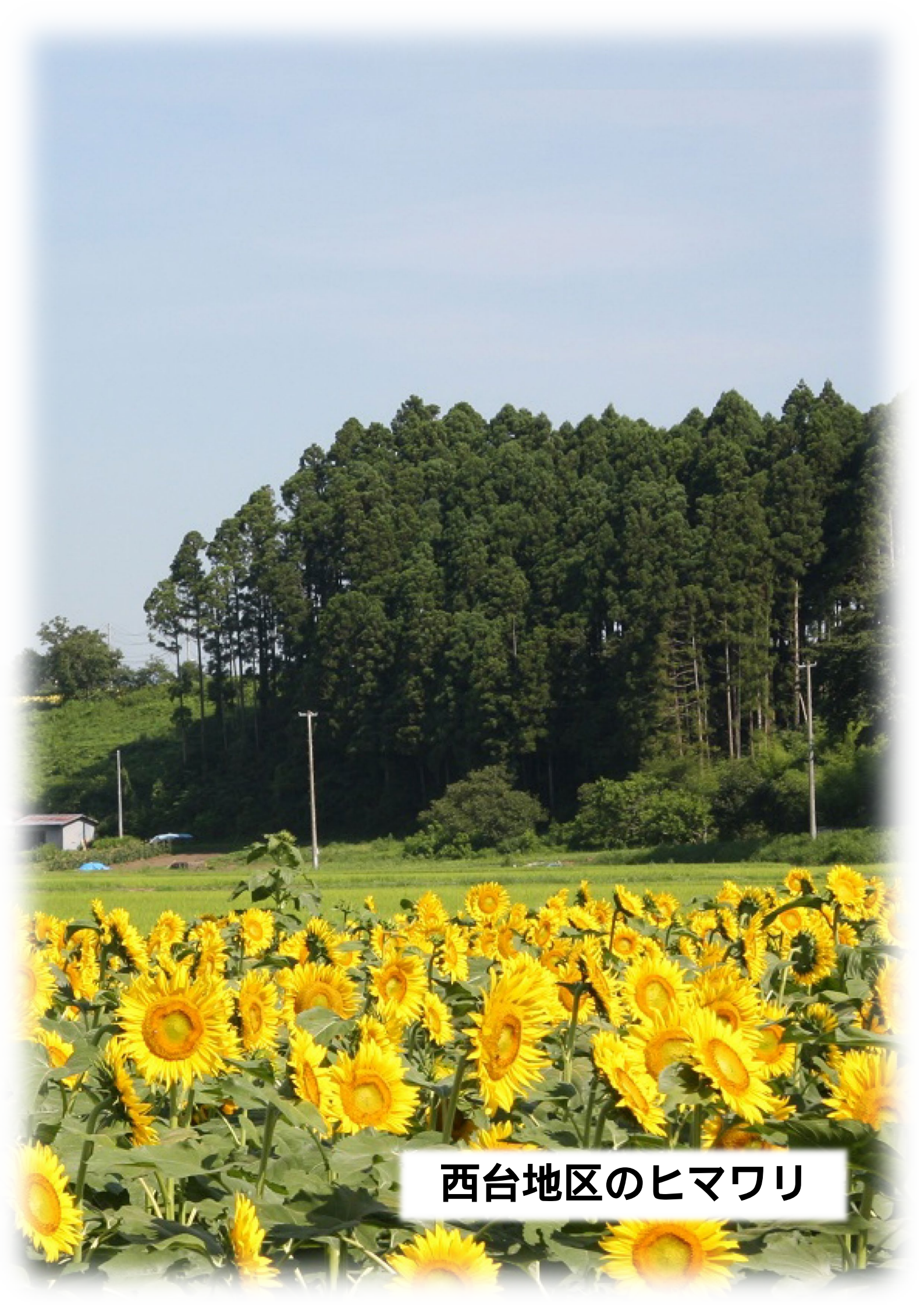
西台地区のヒマワリ