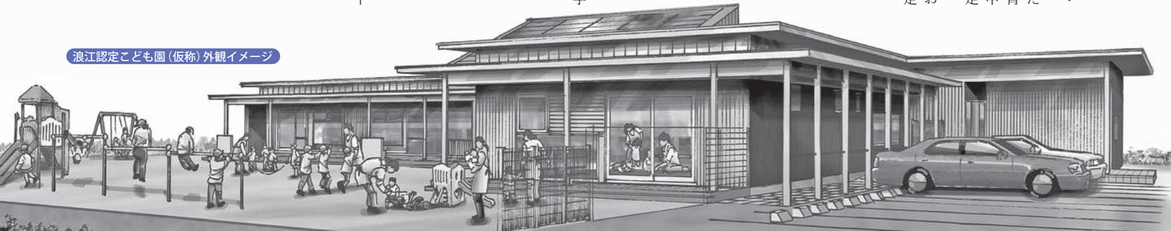
浪江認定こども園(仮称)外観イメージ